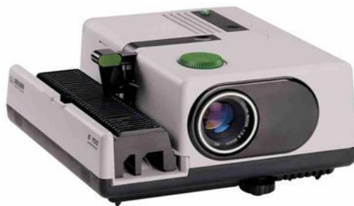
Slika 12. Dijaprojektor VEGAMAT 150AF sa dijafilmom

Film je jedan od najvažnijih izuma u fotografiji koji je omogućio jednostavno zapisivanje svjetla na medij. Filmovi su zapravo prozirne plastične (celuloidne) vrpce koje na sebi imaju tanke premaze kemikalija koje su osjetljive na svjetlo. Zato nerazvijeni film ne smijemo izlagati svjetlu jer ga uništiti. Film koji se nalazi u posebnoj zatvorenoj kutijici ulaže se u klasični fotoaparat i zatim se zatvara kako se ne bi osvijetlio. Kad se pritisne okidač na aparatu, film se kratko osvjetljava i zatim se mora pomaknuti navijanjem kako bi se kodnarednog okidanja aparata osvijetlio sljedeći dio filma. U jednoj kutijici najčešće ima filmaza 36 ekspozicija, što znači da se jednim filmom može dobiti 36 negativa (ili pozitiva, ako je film pozitiv) i 36 fotografija. Kad se film „ispuca“ u fotoaparatu se premota u svoju kutijicu i s tom kutijicom ide na razvijanje u tamnu komoru, gdje se razvijanjem dobiva negativ (suprotnih boja od onih u prirodi). Od negativa daljnjim prenošenjem na foto papir dobiva se fotografija . [9]