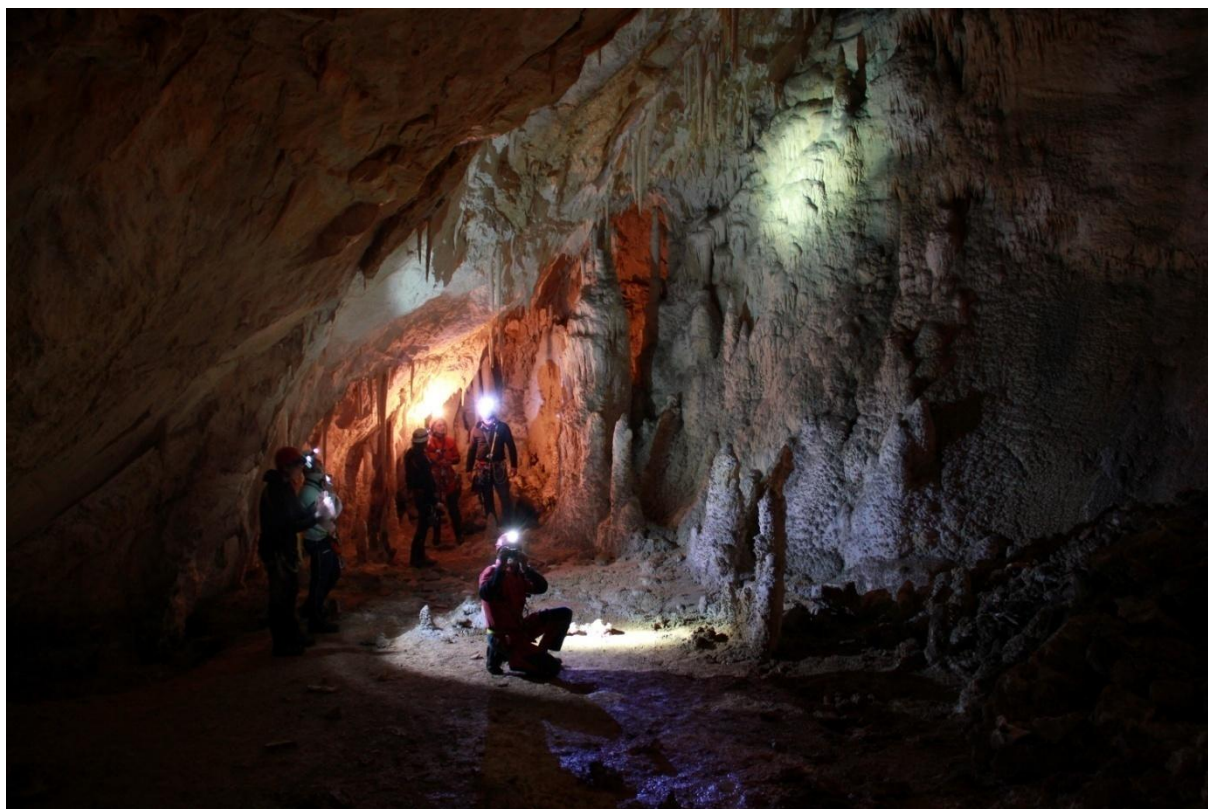
Slika 21. Špilja Krjava, 18.05.2014. , fotoapararat Canon EOS 550D

Fotografija je snimana bez dodatne rasvjete osim 5 čeonih električnih lampi, jedne ručne električne lampe i jedne karbidne (crvenkasto svijetlo). Rađena je bez bljeskalice. Fotoapararat je stajao na stativu, a objektiv EF-S 18-135mm IS je otvora f/3,5 ; osjetljivost 1600 ISO; brzina eksponiranja 1/30 s. Primjećujemo kako je svjetlost koju daje karbidna lampa prilično raspršena, za razliku od električnih lampi koje daju usmjeren snop svijetla.