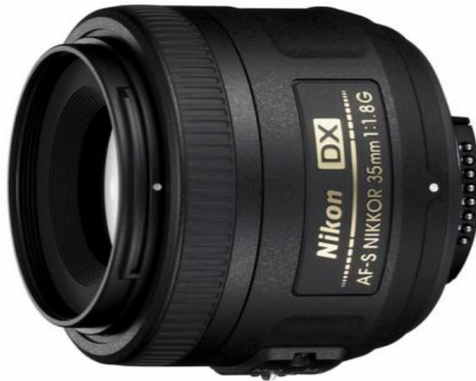
Slika 10. Fiksni objektiv AF-S DX NIKKOR 35mm f/1,8g

Od fiksnih objektivu u speleologiji se uglavnom koriste širokokutni objektivu i normalni, a rjeđe makro objektivu.