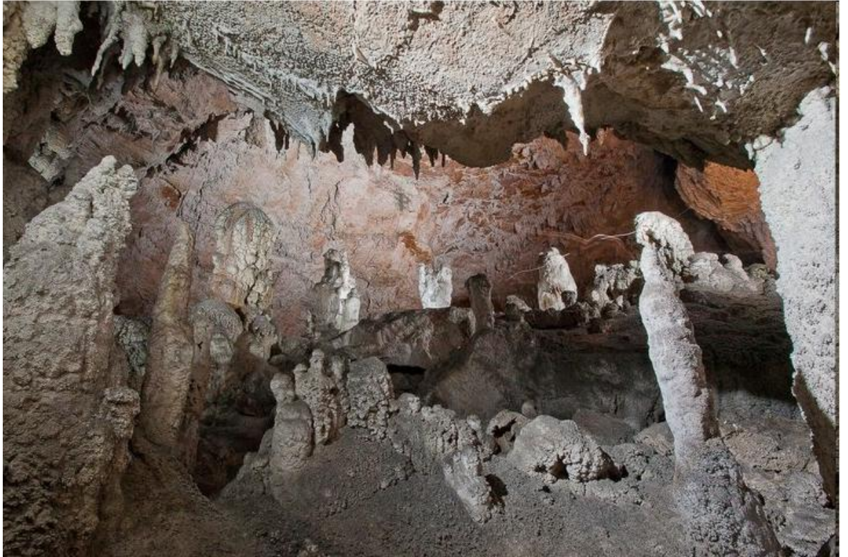
Slika 23. Jama za Piščetom, 20.02. 2011., fotoaparata Canon EOS 5D Mark II

Fotografija je rađena fotoaparatom Canon EOS 5D Mark II i objektivom EF-S 18-135mm sa postavkama B brzine ekspozicije (beskonačno). Rasvjeta je kombinirana - vanjska bljeskalica i tri černe karbidne lampe. Fotografija je dobro osvijetljena i svi detalji vidljivi.