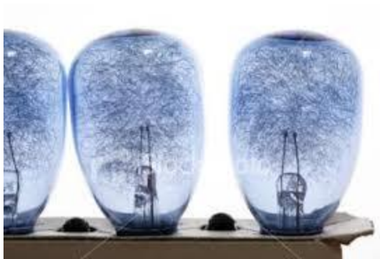
Slika 6. Magnezijeve žaruljice za bljeskalicu

Električna bljeskalica je bila u širokoj upotrebi 1950-tih i 1960-tih godina a zatim ih je potisnula elektronska bljeskalica. Magnezij je smješten u žaruljicu u obliku finih niti i okružen kisikom pod određenim tlakom (slika 6). Ove okolnosti određuju trenutano kontrolirano izgaranje magnezija. Izvana je žaruljica prekrivena slojem prozirne elastične celuloze koji zadržava krhotine stakla nakon izgaranja. [1] Postoje magnezijeve bljeskalice čak jače od elektronske, ali se svjetlo usmjerava samo u uskom snopu prema objektu. Temperatura boja im je od 3800°K do 5500°K. Brojka vodilja između 35 i 160.