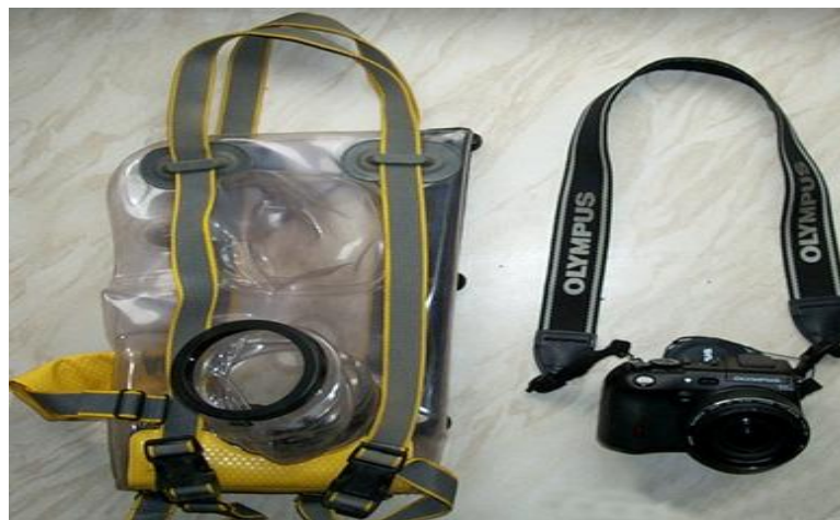
Slika 8. Olympus C8080WZ CCD (kompaktni) fotografski aparat

Kompaktni fotoaparati su manji, praktičniji i jednostavniji. Sastoje se od manjeg tijela koje je najčešće veličine šake (slika 8). Imaju jedan objektiv promjenjive žarišne duljine, tzv. zoom objektiv i najčešće ugrađenu bljeskalicu. Njima se fotografira tako da se na LCD zaslonu (koji je na stražnjoj strani aparata) odredi kadar i jednostavnim pritiskom na okidač (najčešće na vrhu aparata) snimi fotografija. Ovakvi fotoaparati uglavnom nemaju optičko tražilo. Ako ga i imaju njime se ne gleda kroz objektiv, već kroz poseban prozorčić. Imaju ograničene mogućnosti za kreativno snimanje, no neki od njih ipak nude neke mogućnosti kontroliranja bljeskalice, određivanje modusa snimanja (makro, sport, pejzaž, portret, noćno snimanje) te podešavanja svjetline fotografija. Prvenstveno su napravljeni za snimanje u automatskom režimu. Fotoaparati bez mogućnosti ručnog podešavanja nazivaju se „point and shoot camera“. [9]