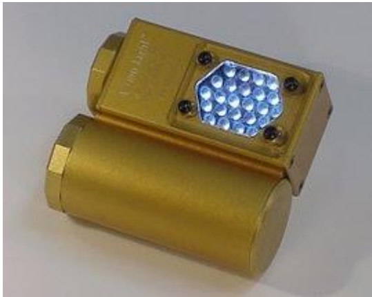
Slika 5. Čeona električna rasvjeta

Električna rasvjeta se sastoji od izvora struje i odgovarajućih žarulja (slika 5) ili reflektora. U turistički uređenim špiljama već postoji takva rasvjeta. Izvor struje može biti generator, ali se uglavnom koriste akumulatori jer su povoljniji i lakši za transport. Ponekad se za fotografiranje koristi i ručna baterijska svjetiljka, pogotovo ako je jakog inteziteta. [1]