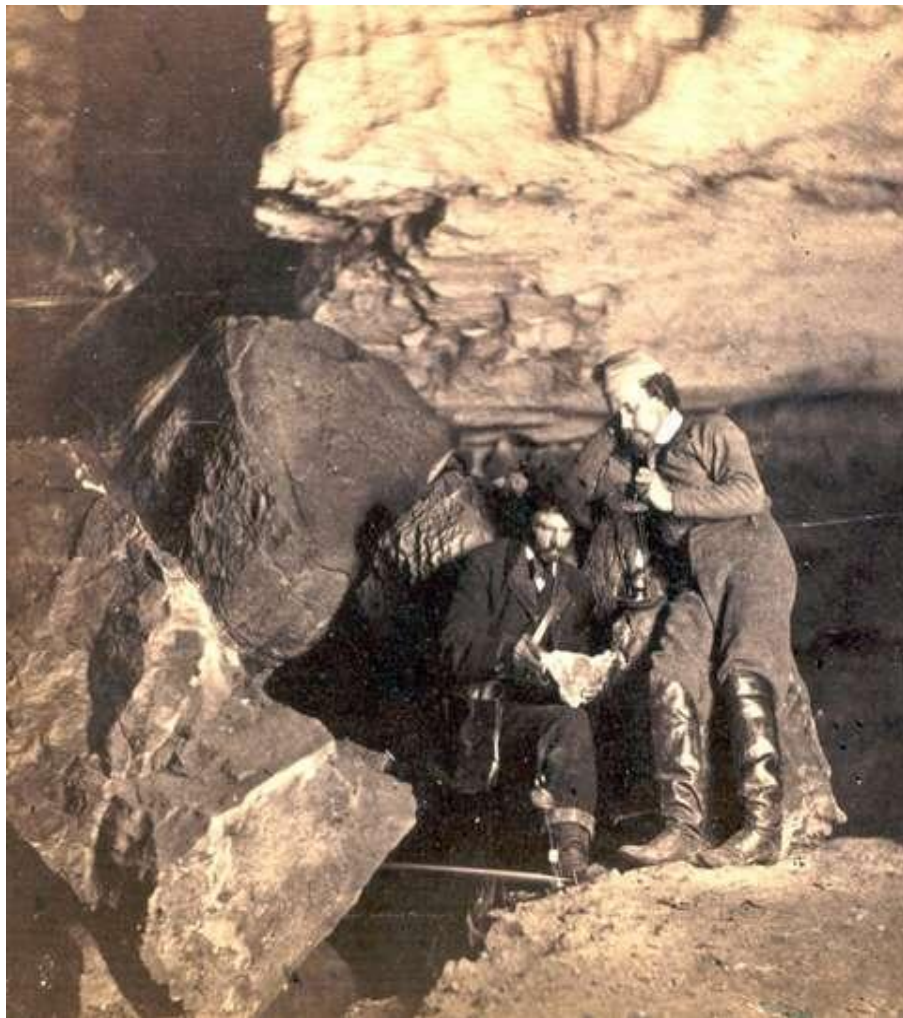
Slika 2. Charles Waldack Beyond the "Bridge of Sighs" , 1866 [Mammoth Cave Views]

Iako skup, magnezij je bio jedini izvor svjetla za rad pod zemljom. Godine 1866.belgijski imigrant Charles Waldack (1831-1882) pri fotografiranju u špilji Mammoth Cave, Kentucky (slika 2), koristi 120 magnezijevih svijeća i stvara 80 negativa. Četrdeset od njih su označene i odobrene kao stereo view. Waldack razvija tehnike i načela u podzemnoj fotografiji koji ostaju vodeći i danas.Rasvjeta mora biti postavljena sa strane fotoaparata, nikako u smjeru optičke osi. Koristio je širokokutni fotografski aparat montiran na stativ, čime je riješio pomicanje aparata za duge ekspozicije. [8]