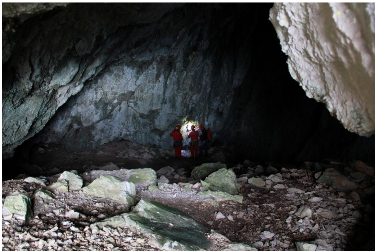
Slika 20. Špilja Krjava, 18.05.2014. , fotoapararat Canon EOS 550D

I ova fotografija je snimana na isti način kao i prethodne, sa istom opremom, istom rasvjetom, i istim otvorom objektiva, ali ovdje je osjetljivost smanjena na 800 ISO, a brzina eksponiranja 1/30 s. Fotografija je prilično tamna, ali za razliku od prethodnih ima manje šuma. Dubina polja je i ovdje prilično dobra, kao i na prethodnim fotografijama. Smanjivanjem otvora objektiva dobila bi se veća dubina polja, ali na štetu rasvjete, koja se ovdje ne može žrtvovati zbog nedostataka dodatnih izvora svjetla.