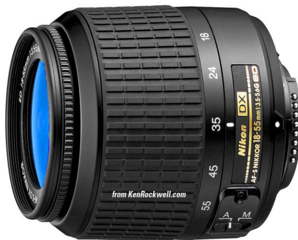
Slika 11. Nikon AF-S DX zoom objektiv 18-55mm f/3.5-5.6.