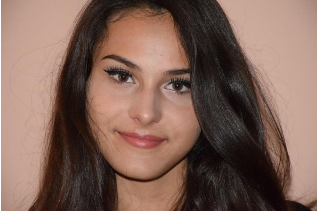
Slika 40. Portret lica, f/8, 1/200