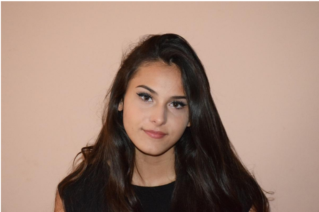
Slika 41. Portret lica, f/8, 1/100