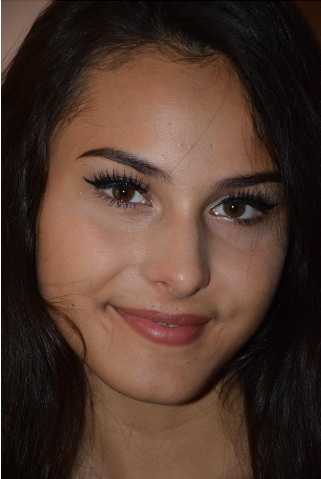
Slika 39. Portret lica rezan na gornjem dijelu glave, f/5.6, 1/200