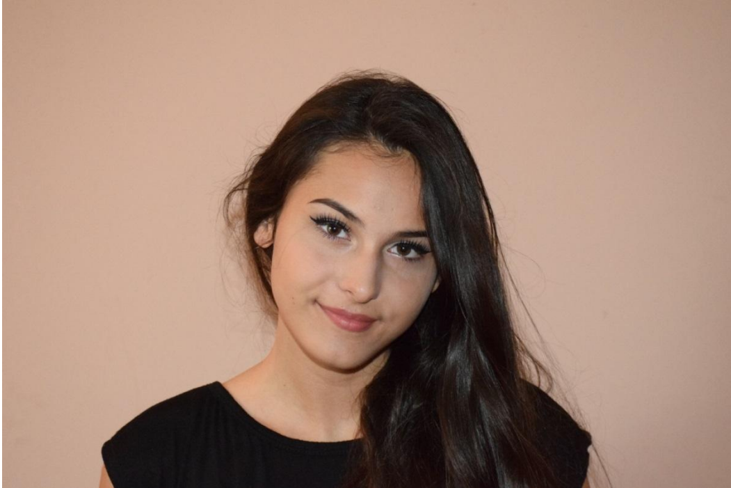
Slika 30. Portret lica, f/8, 1/80

Temeljem teoretičkih razmatranja na slikama 30. – 41. su prikazane autorske portretne fotografije. Fotografije su snimane fotografskim aparatom NIKON D3300