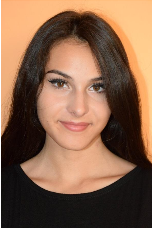
Slika 17. Enface