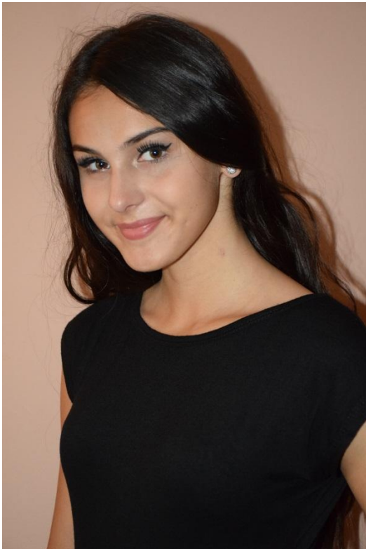
Slika 19. Poluprofil