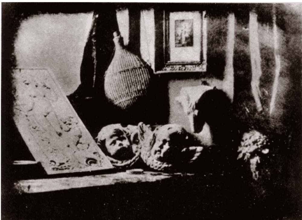
Slika 3. L. Daguerre: „L’atelier de l’artiste” [3]

Dagerotipija je davala oštre slike, no postupak nije bio savršen zbog određenih nedostataka. Slike su bile stranično neispravne i unikatne. Kako se brzo proširio, tako je ovaj postupak i naglo nestao oko 1860. godine.