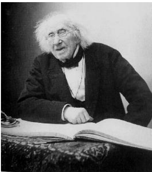
Slika 6. F.Nadar: Chevreulo – prvi intervju 1886. [6]