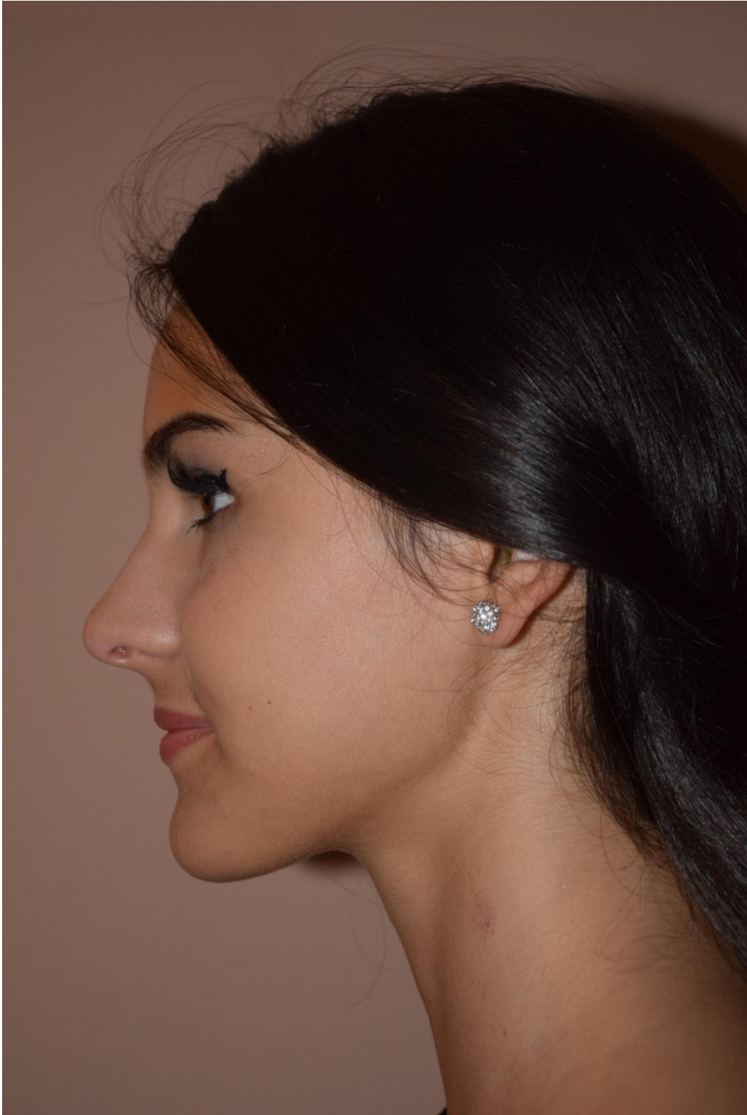
Slika 38. Profil, f/4.5, 1/125