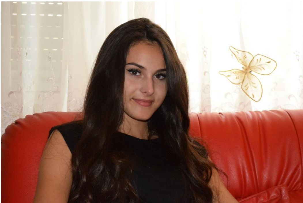
Slika 31. Portret lica, f/8, 1/200