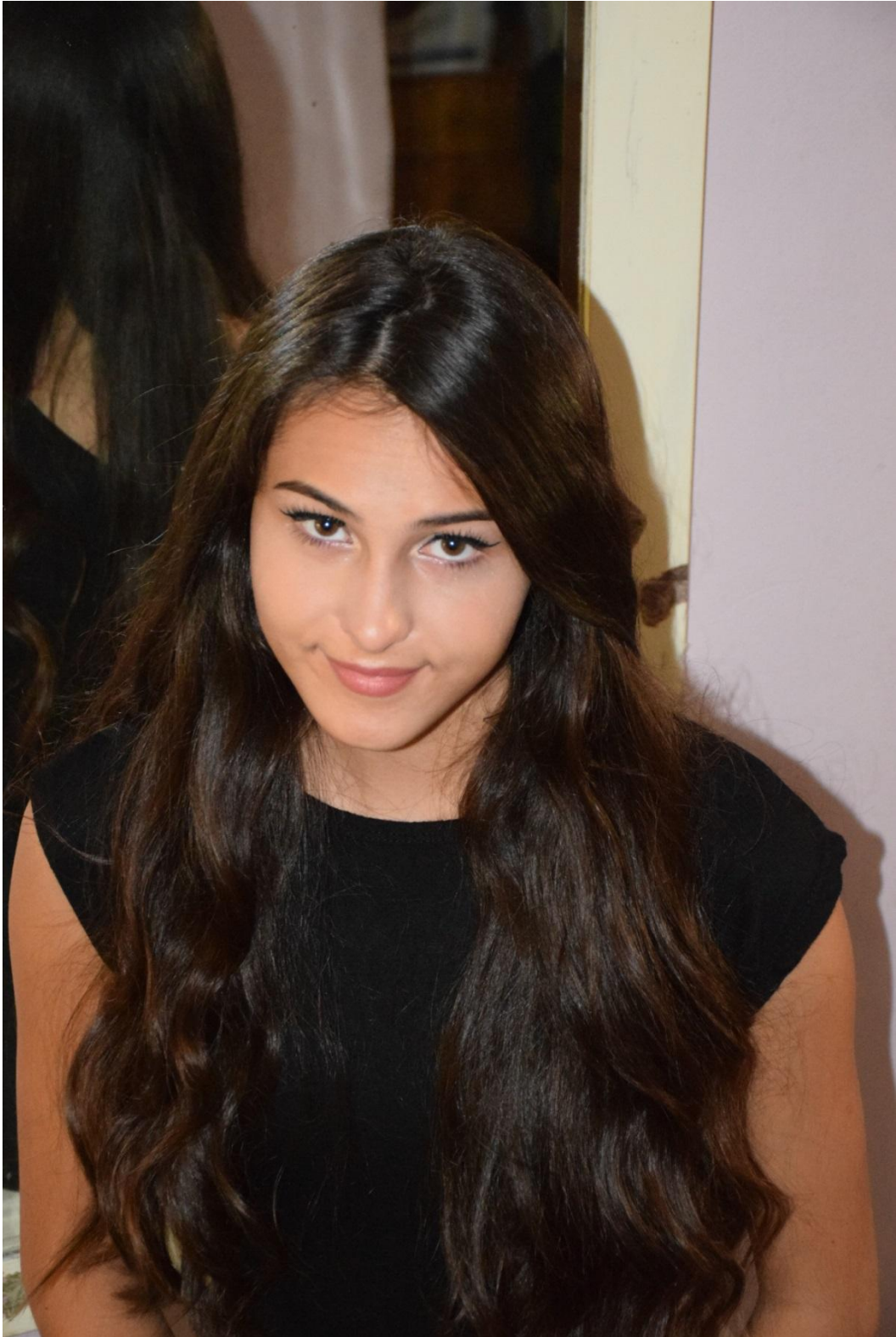
Slika 35. Gornji rakurs, f/4.8, 1/200