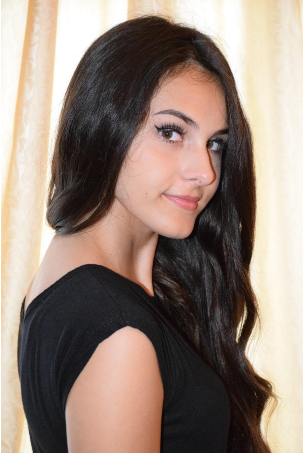
Slika 37. Tročetvrtinski profil, f/6.3 , 1/125