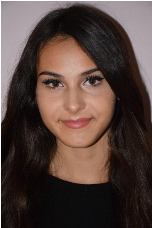
Slika 21. Normalna vizura

Promjenom rakursa donekle se mijenja i perspektiva. Rakurs je u izravnoj vezi s motrištem, kadriranjem pa i orijentacijom slike. I vrlo mala promjena rakursa može snažno djelovati na promatrača fotografije. [4]