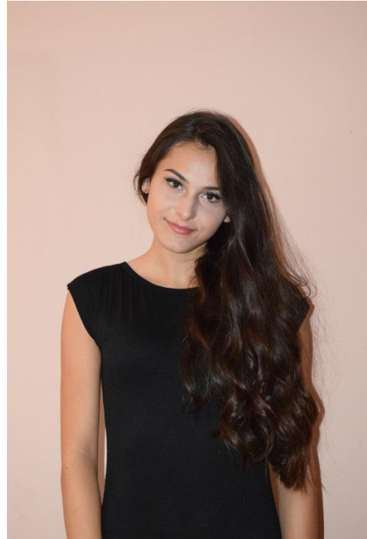
Slika 9. Portret lica – američki rez