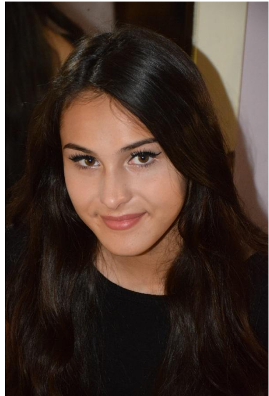
Slika 23. Gornji rakurs