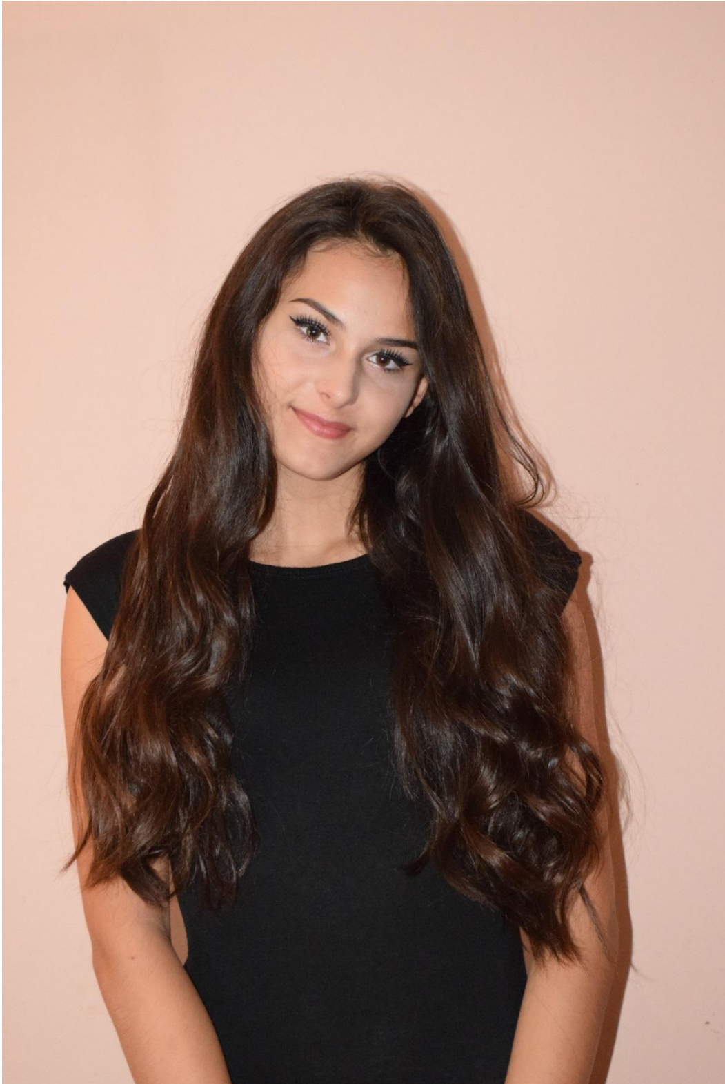
Slika 32. Blizi plan, f/8, 1/80