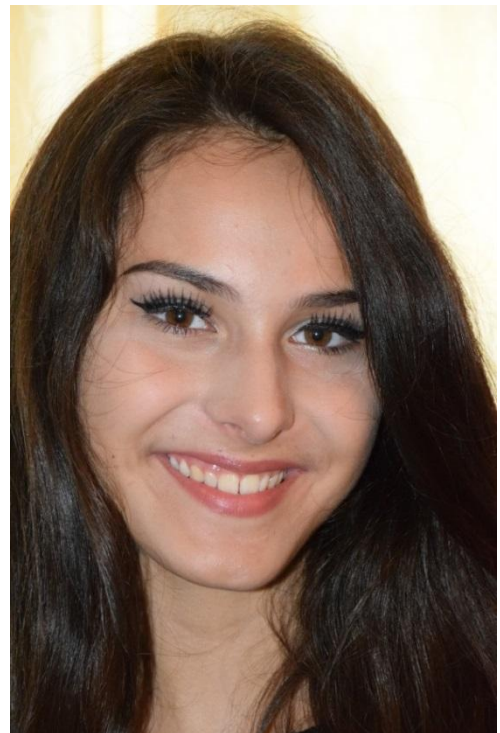
Slika 15. Krupni plan