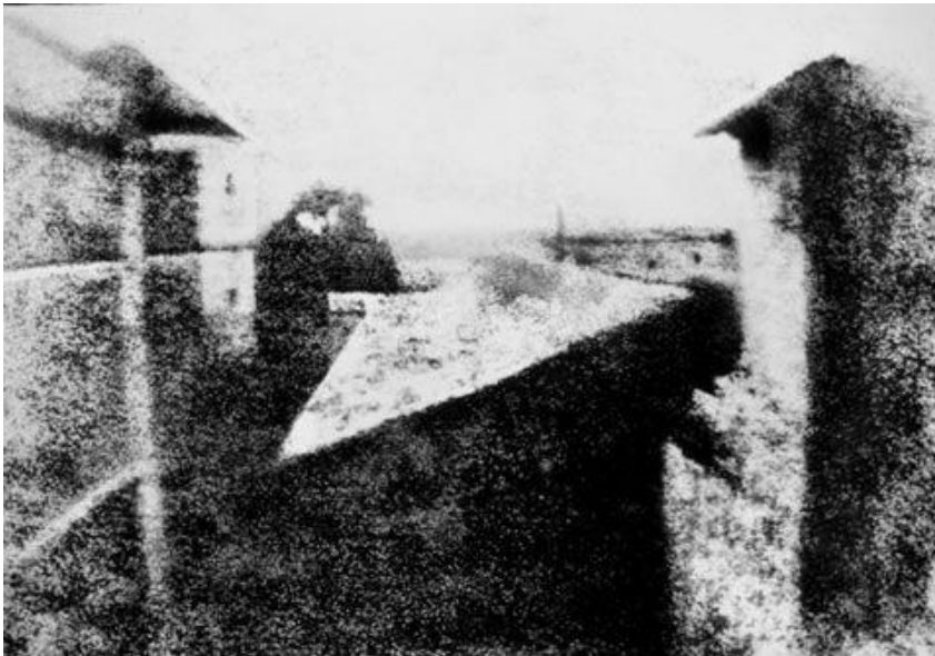
Slika 1. Niépce : „Pogled s prozora“ [1]

Prva poznata fotografija u povijesti, "Pogled s prozora" 1824., Joseph Nicéphore Niépce.