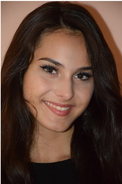
Slika 26. Pojedinačni portret

Kako se kroz portret pokazuje stav fotografa prema fotografskoj ličnosti, važno je poznavanje osobe koja se snima, tj. postojanje stava fotografa prema toj osobi. [6]