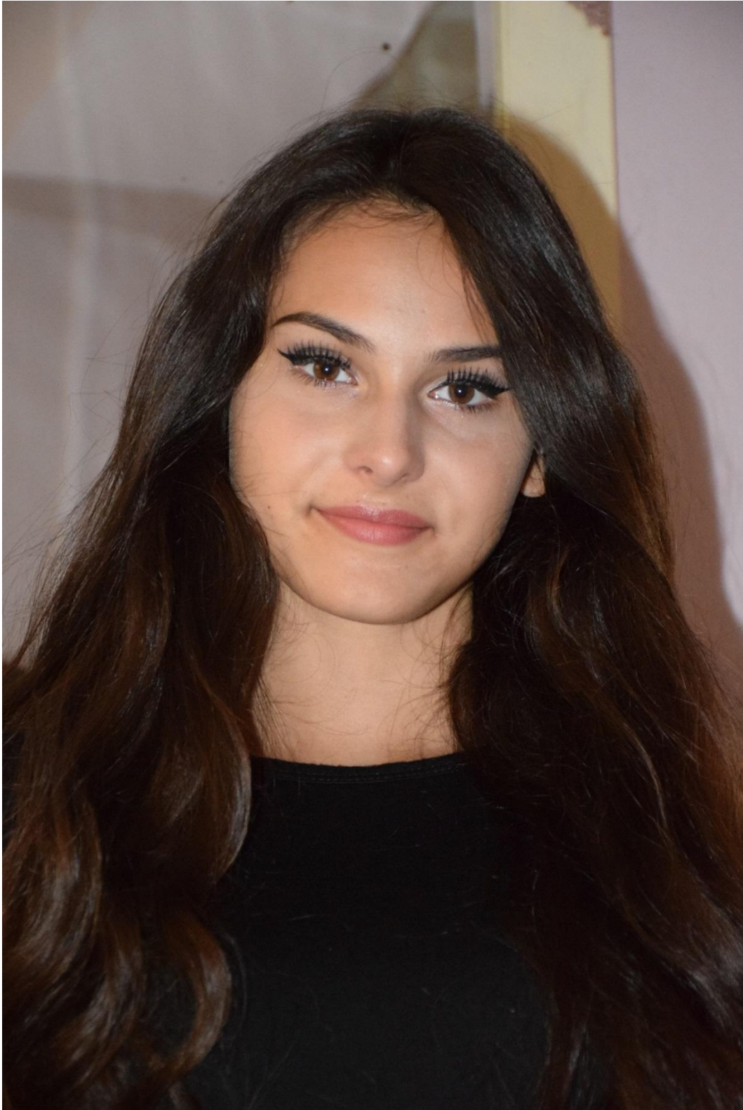
Slika 36. Donji rakurs, f/5, 1/200