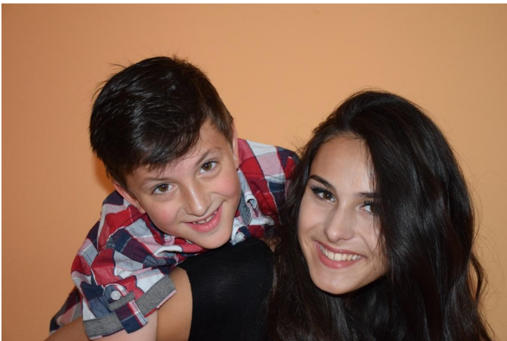
Slika 27. Grupni portret

Tehnika rasvjete može, također, biti neuobičajena. Protusvjetlom se mogu „izvući“ konture, a zatim reflektorom čitavoj kompoziciji dati dubinu i naglasiti određena mjesta. Razbijanju simetrije i stvaranju dodatne točke interesa može pridonijeti upotreba raznih rekvizita u ateljeu. Kada se snimaju dvije osobe nabolje je da jedna bude dominantna i središte interesa. [6]