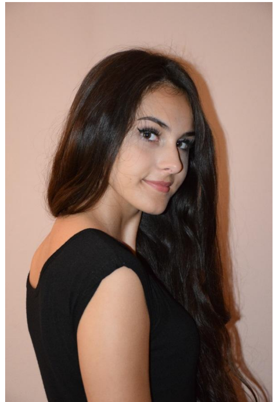
Slika 20. Tročetvrtinski profil