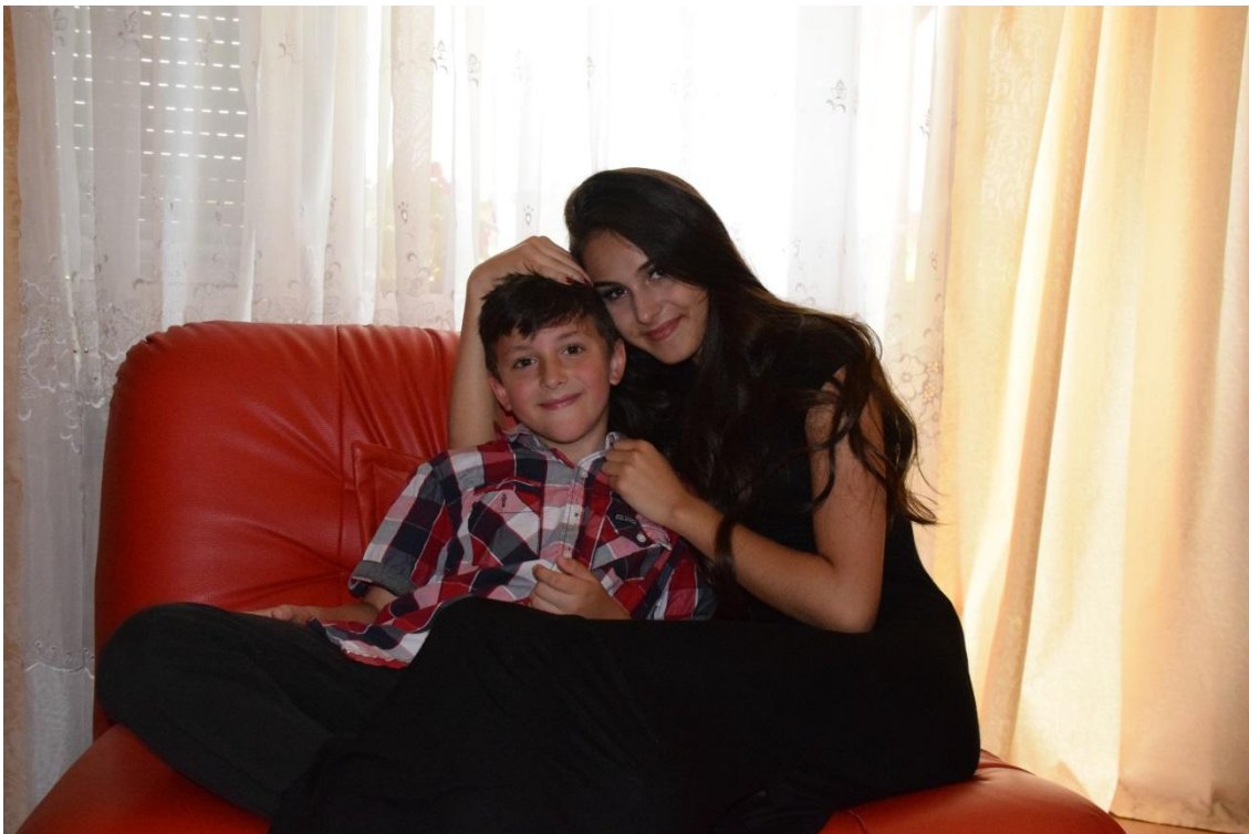
Slika 12. Total plan

U osnovi, plan fotografije se određuje prvenstveno pri snimanju, a u manjoj mjeri pri povećanju ili obradi. O planovima se ponekad govori i na jednoj fotografiji – ono što se pri snimanju nalazilo najbliže fotoaparat predstavlja prvi plan, a ostali su dalji planovi (drugi, treći..). [3]