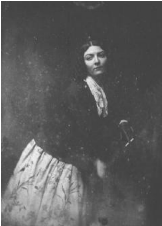
Slika 2. Dagerotipija 1837. [2]