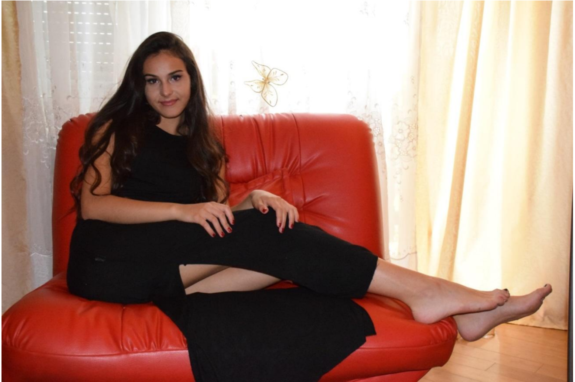
Slika 13. Srednji plan