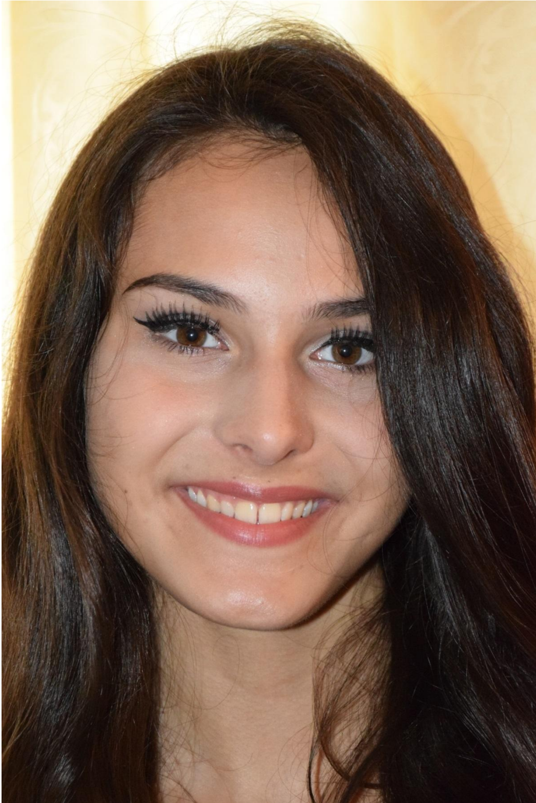
Slika 33. Krupni plan, f/9, 1/125