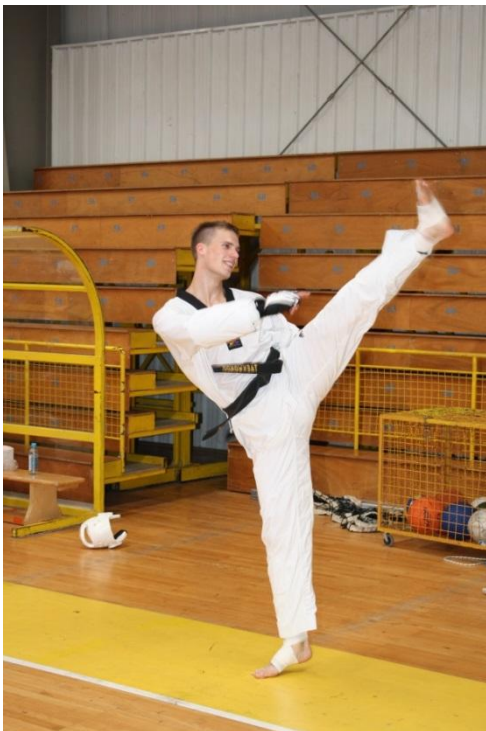
Slika 28. Okolina i životni prostor

Ako se želi snimiti portret osobe u njenoj prirodnoj okolini, smjestit će se naravno u prvi plan ili na srednju udaljenost. Portret seljaka koji stoji daleko u žitnom polju, neće biti naročito izražajan. Treba ga snimiti tako da gospodarstvo ili polje budu u pozadini pa čak, možda, izvan središta, kako se ne bi remetila kompozicija. [6]