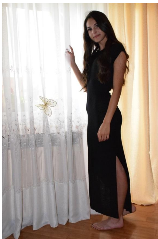
Slika 11. Portret cijelog lika