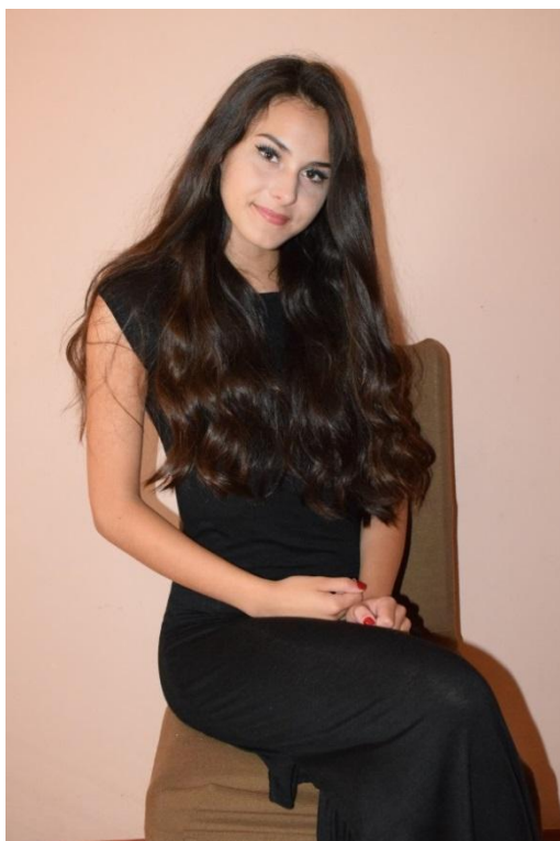
Slika 10. Portret 2/3 lika