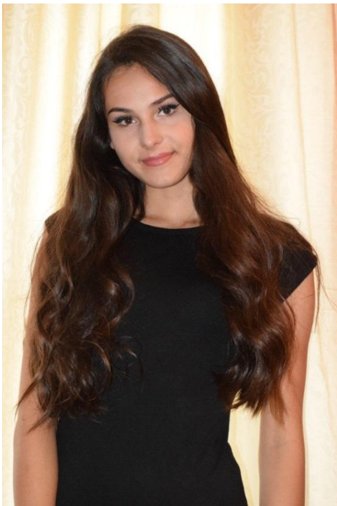
Slika 14. Blizi plan