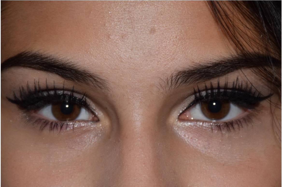
Slika 16. Detalj