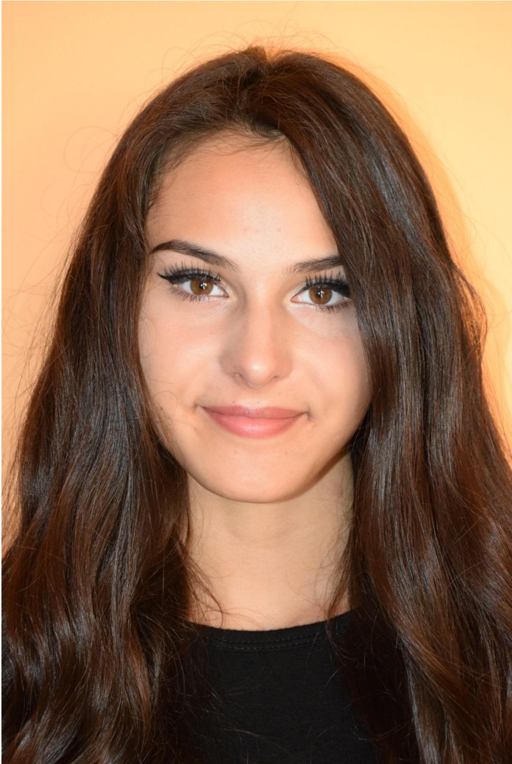
Slika 34. Enface, f/8, 1/200