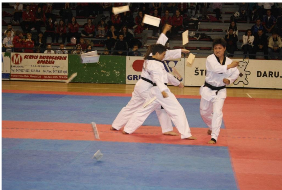
Slika 29. Skriveni fotografski aparat

Mnogi reporteri na svojim fotografskim aparatima imaju unaprijed namješteno vrijeme eksponiranja – 1/250 sek. – i otvor objektiva – f/11. Drugi vole snimati iz veće udaljenosti, teleobjektivom. Iskustvom se opredijeli za sistem koji najbolje odgovara svakom pojedincu. Fotoreporter zaustavlja prolazne događaje čovjekove povijesti i njegova ponašanja ostavljajući izuzetno vrijedne dokumente vremena. [6]