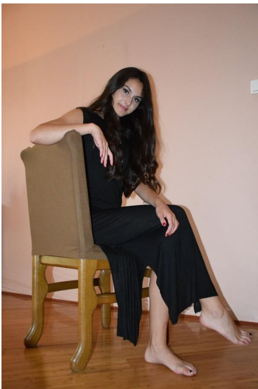
Slika 24. Žablja perspektiva