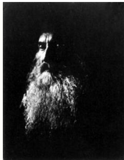
Slika 7. M.J.Cameron: H.Taylor 1865. [7]