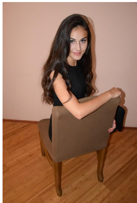
Slika 25. Ptičja perspektiva