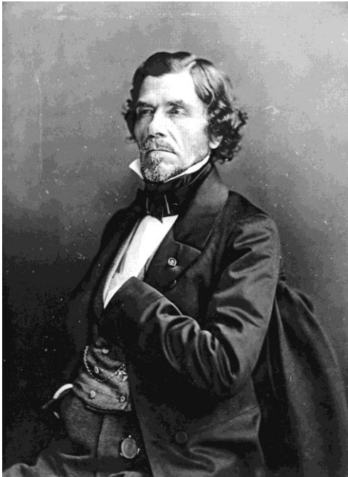
Slika 5. F.Nadar : „Delacroix“ [5]

Nadar je portretirao Delacroixa i Hugoa, a proslavio se portretima francuskih intelektualaca šezdesetih i sedamdesetih godina 19. stoljeća.