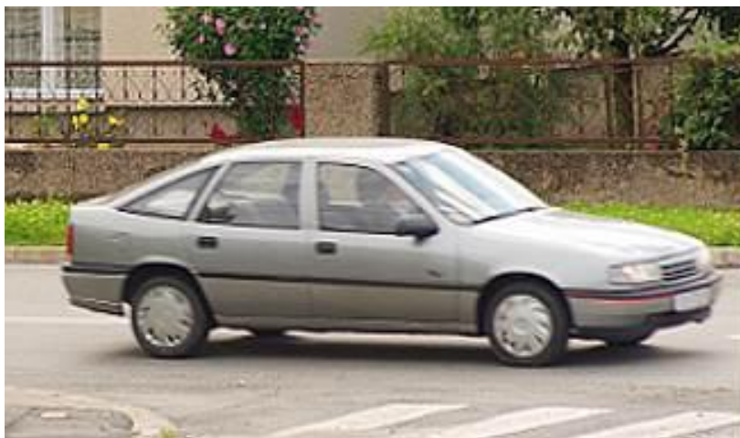
Slika 2.4.6. Velika brzina eksponiranja