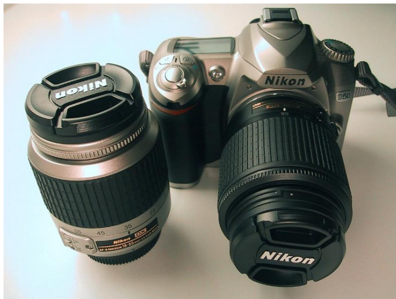
Slika 2.3.5. SLR (polu)profesionalna zrcalno-refleksna digitalna kamera s izmjenjivim objektivima