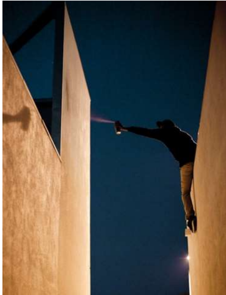
Slika 16. Grafiter, Keegan Gibbs

umjetniku i načinu kako je proveden izlazak s umjetnikom. Zato je počeo pratiti svoje fotografije esejima i pričama o noćnim izlascima s umjetnicima [9].