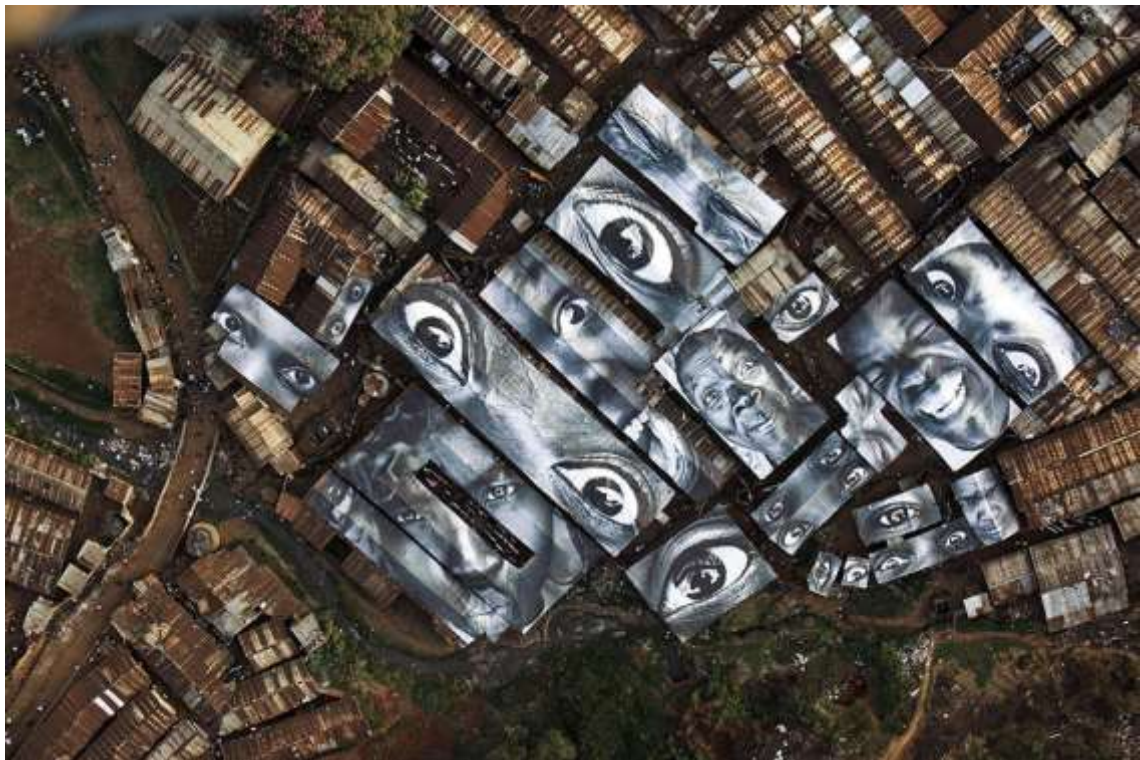
Slika 17. Womens are Heroes projekt, JR

are Heroes (Slika 17), gdje je predstavio lica žena koje su imale tešku prošlost i žele bolju budućnost [9].