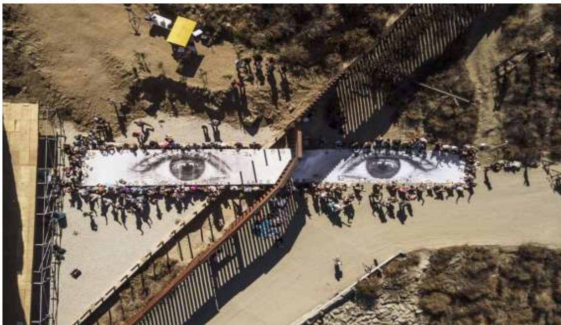
Slika 18. Ulična umjetnost sa porukom, JR