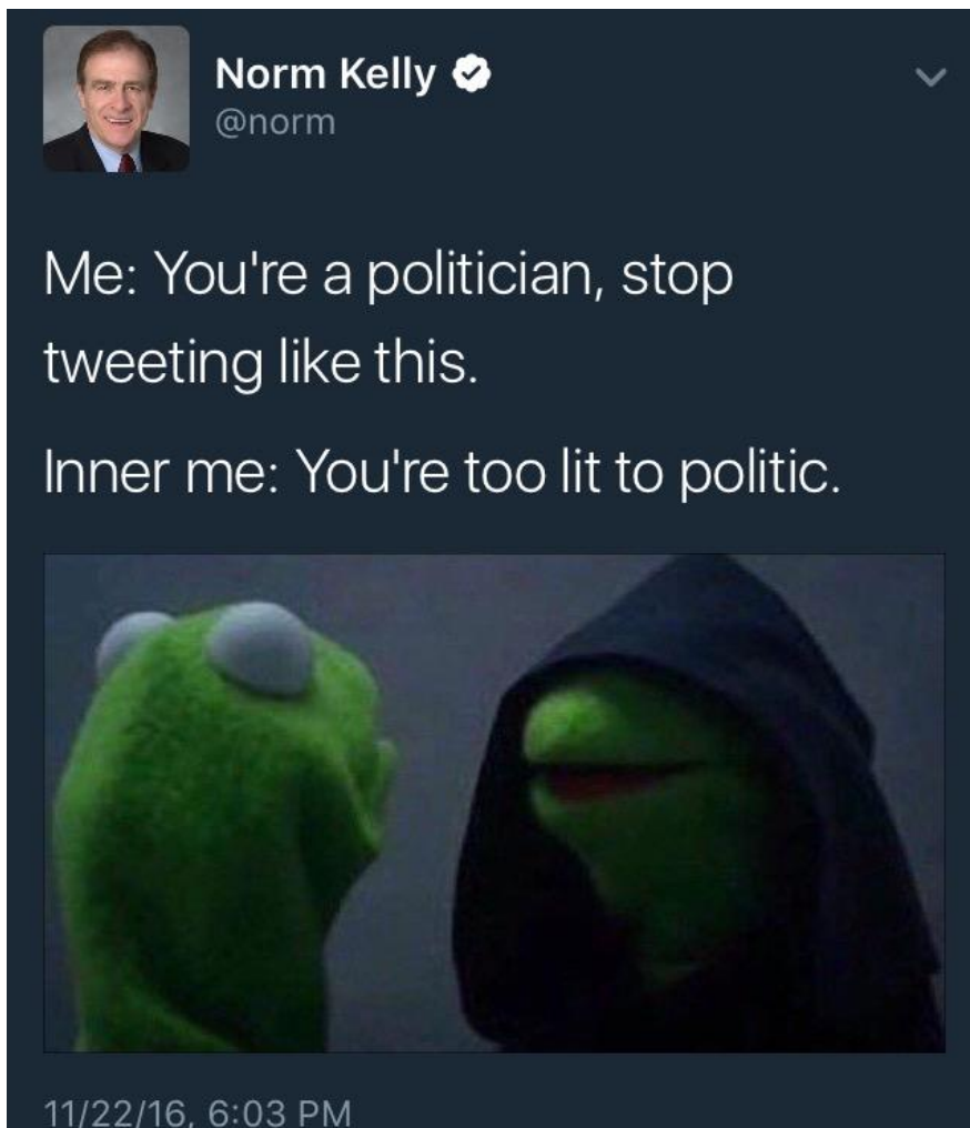
Slika 4.3.2. – Tweet kanadskog političara Norma Kellya [36]