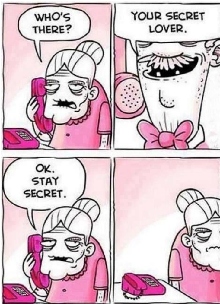
Slika 2.2.1. – korištenje humora u stripu [16]