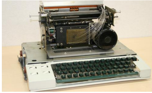
Slika 2 – OKI Matrix printer iz 1968.

iReTron Blog, Technology Flashback: The Dot Matrix Printer