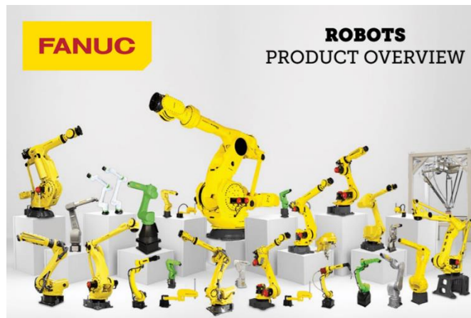
Slika 9 – Asortiman Fanuc robota

Ova funkcija dostupna je za sve Fanuc robote i dovoljna je za jednostavne zadatke. Za složenije zadatke, programer koristi iPendant ručni terminal ili iRProgrammer, programe za pametne uređaje. [11]