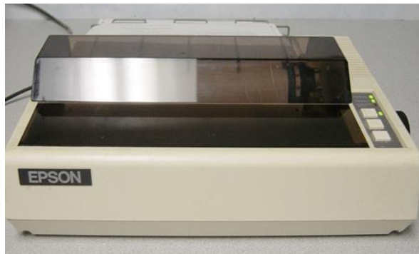
Slika 3 – MX – 80 Epson printer iz 1980.

Prvi komercijalni tiskari općenito su koristili mehanizme iz električnih pisaćih strojeva. Potreba za većom brzinom dovela je do razvoja novih sustava posebno za korištenje računala. U 1980-ima postojali su sustavi s kotačićima slični pisaćim strojevima, linijski pisači koji su proizvodili sličan ispis, ali puno većom brzinom, i matični sustavi koji su mogli miješati tekst i grafiku, ali su proizvodili ispis relativno niske kvalitete (slika 3.). Crtač ( plotter ) je korišten za one koji su zahtijevali visokokvalitetnu linijsku umjetnost poput nacрта. [8]