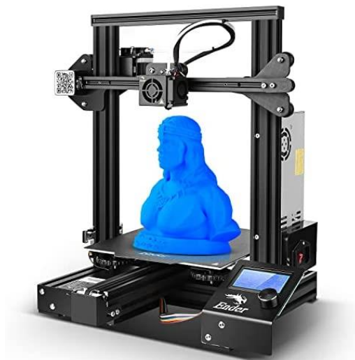
Slika 5 - Official Creality Ender 3 Pro 3D

Amazon, 3D printer ( https://www.amazon.ae/Official-Creality-3D-Certified-220x220x250MM/dp/B07K3SZBHH 3D printer )