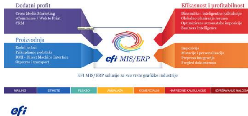
Slika 10 – Prikaz EFI solucija vezanih za grafičku industriju

za uspješnu budućnost svake tvrtke iz grafičke industrije (slika 10.). Ovakvi proizvod predstavljaju sadašnjost i budućnost načina rada svake kompanije. [12]