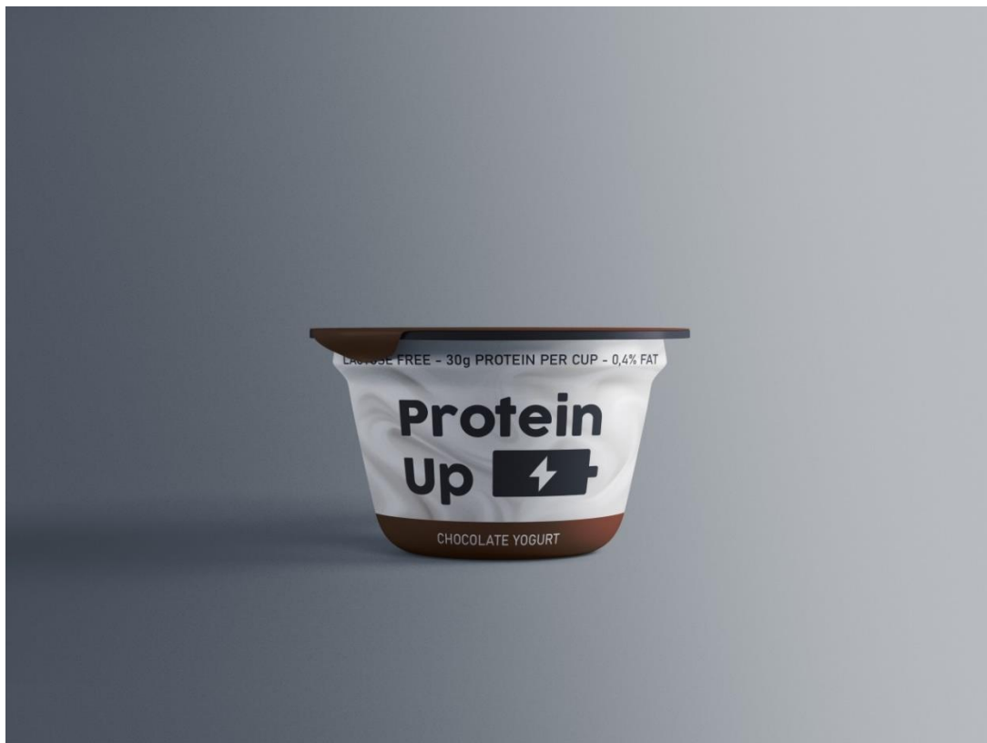
Varijanta 1 – okus čokolada; crna boja #231F20, smeđa boja #77340E; obrazac: Graphicpear.com