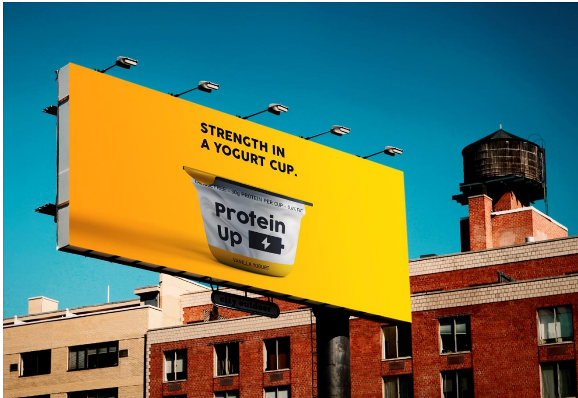
Primjer 2 – billboard; obrazac: Designbolts.com