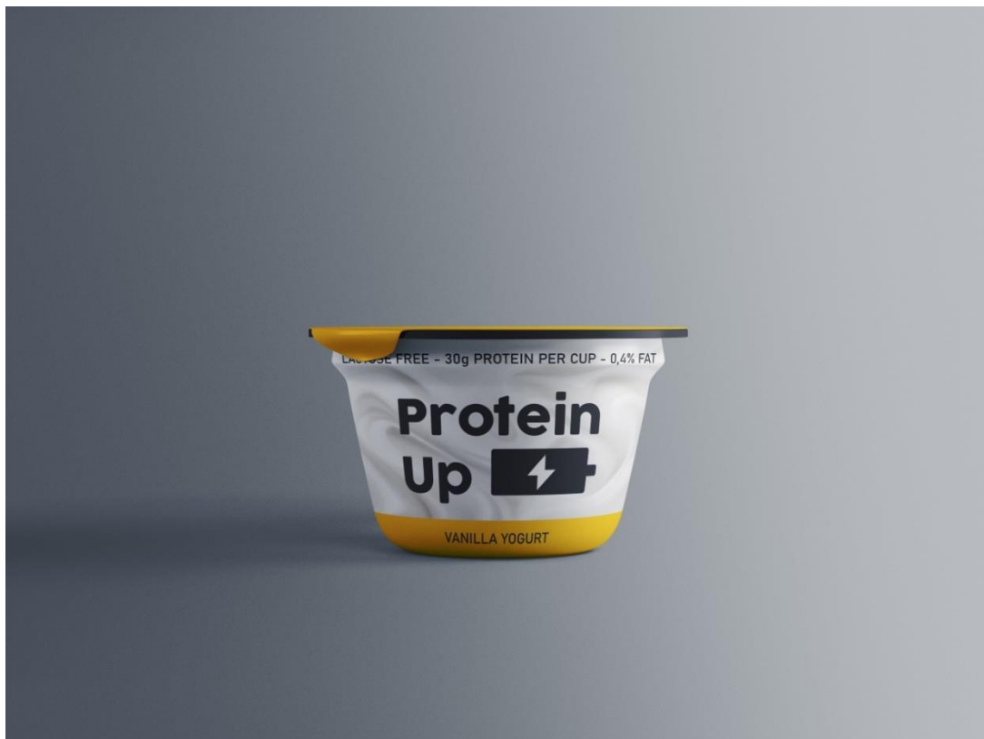
Varijanta 2 – okus vanilija; crna boja #231F20, žuta boja #FFCE00; obrazac: Graphicpear.com