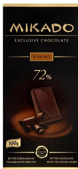
Sl.8.: korištenje crne i zlatne ukazuje na ekskluzivnost proizvoda, izvor: Stridon.hr

proizvod usmjeren ili daje informacije o načinu proizvodnje. Ljubičasta, zlatna i crna ukazuju na ekskluzivnost, skupoću, luksuz i kvalitetu u određenim segmentima proizvoda (primjer Sl.8.) dok plavi tonovi imaju tendenciju prenijeti osjećaj tradicije, konzervativnosti i pouzdanost. Korištenje koncepata boja za marke proteže se na obojenost samog proizvoda, čak i za prehrambene predmete u kojima se koriste bojila za hranu. Ovo rezultira svijetlo zelenim graškom i rajčicom koja su svjetlocrvene jer se živopisno obojenje percipira kao znak da je hrana zrelija i zdravija. Također se koriste intenzivnije nijanse kako bi se pokazalo da je proizvod više kvalitete. Jedan aspekt koji je bitan za upotrebu boje u ambalaži jest da reprodukcija boja mora biti točna i dosljedna, posebno s obzirom na dubinu boja. Promjene boje mogu rezultirati pogrešnim uvjerenjem kod kupaca da je proizvod već duže vrijeme na polici ili da je kvaliteta proizvoda upitna.