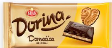
Sl.4/Sl.5.: primjer rebrandinga – čokolada Dorina, izvor: Kraš.hr