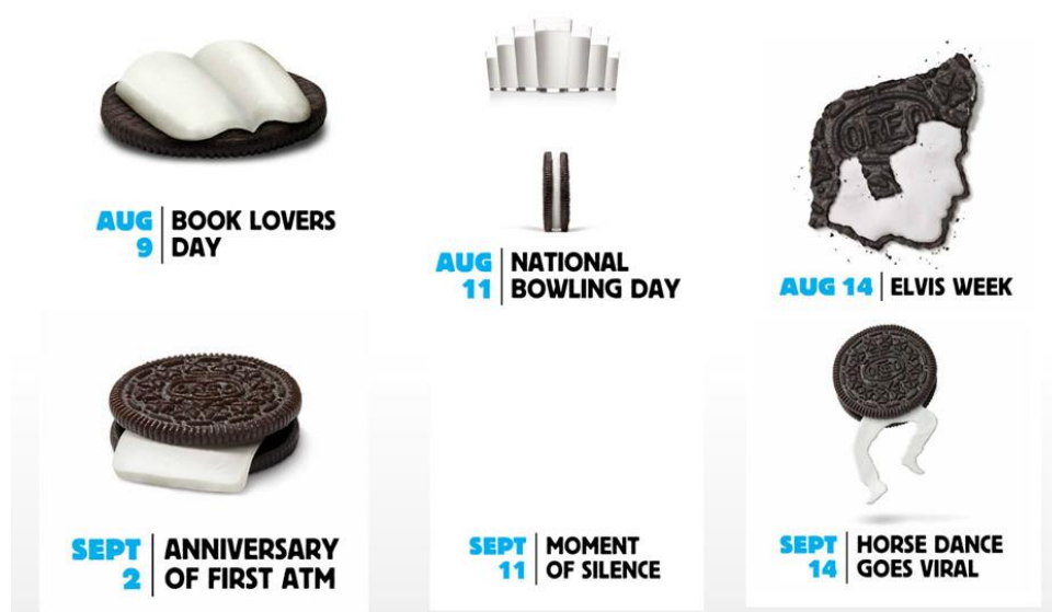
Sl.10. Oreo Daily Twist kampanja

Svi dosadašnji primjeri vizualnog pripovijedanja dokazuju da uspješna marketinška strategija zahtijeva da subjekt pripovijedanja bude kvalitetan jednako kao i upotreba vizualnih sadržaja. Priče mogu dolaziti iz mnogih aspekata poslovanja ili života, bilo da se radi o vrijednostima tvrtke, kako ljudi uživaju u proizvodu, ključnim prekretnicama u životnom vijeku proizvoda itd. U Oreo Daily Twist kampanji za američko tržište 2012. Godine, tvrtka je proslavila stoti rođendan kreiranjem 100 originalnih slika nadahnutih pop kulturom, obilježavajući značajne dane u godini. Ta je kampanja prikupila globalne pohvale i nagrade te redefinirala publicitet za robnu marku Oreo.