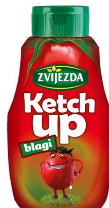
Sl.6/Sl.7.: primjer rebrandinga – Zvijezda ketchup, izvor: Stridon.hr