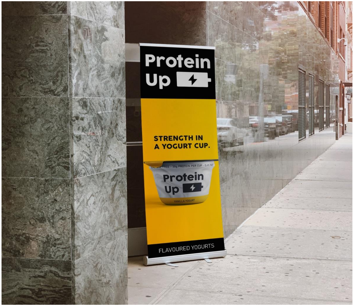
Primjer 3: banner, obrazac: Designbolts.com