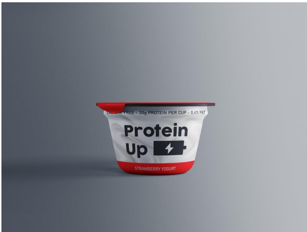
Varijanta 3 – okus jagoda; crna boja #231F20, crvena boja #FF0000; obrazac: Graphicpear.com