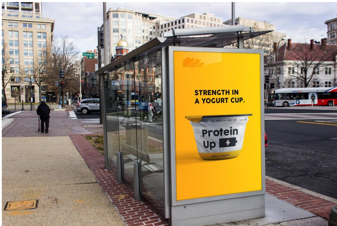
Primjer 1 – autobusna stanica; obrazac: Designbolts.com