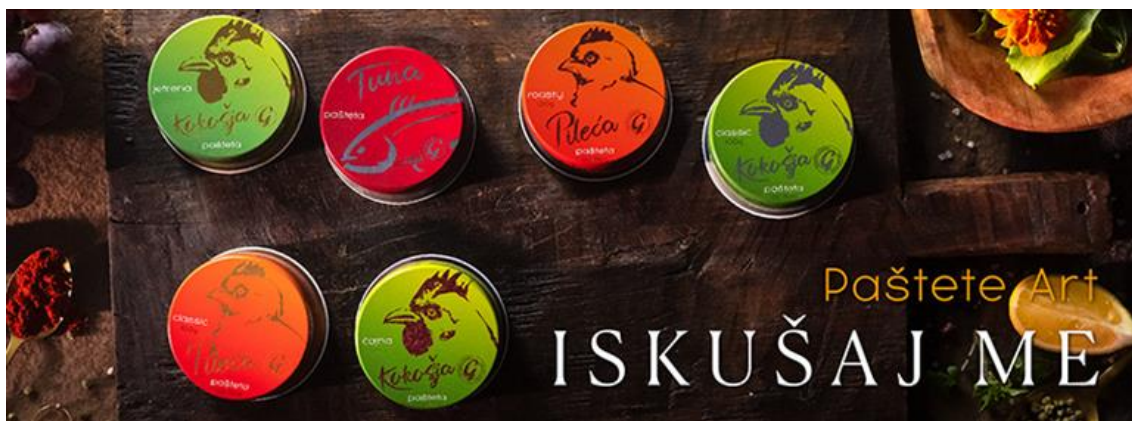
Sl.1. primjer utvrđivanja kategorije proizvoda koherentnim dizajnom ambalaže

„Dizajn ambalaže su oblici, strukture, materijali, boja, slike, tipografija, i regulatorne informacije s pratećim elementima koji čine proizvod pogodnim za marketing i prodaju. Njegov je primarni cilj stvoriti pakiranje koje proizvodu omogućiti: zaštitu, transport, izlaganje na policama, skladištenje i identifikaciju u trgovinama. U konačnici, dizajn treba ispuniti marketinške ciljeve prepoznatljivom komunikacijom osobnosti ili funkcije potrošačkog proizvoda i generiranjem prodaje.“ [2] S obzirom na sve veću konkurenciju proizvoda raste i potreba za tržišnim razlikovanjem i diferencijacijom. Jednostavno rečeno - uspješan dizajn ambalaže stvara želju kod kupca. Dizajn ambalaže jedan je od komponenti u složenom sklopu marketinških aktivnosti koje teže stvaranju lojalnosti marki i prodaji proizvoda. Uspješan dizajn ambalaže ovisi o jasno definiranoj strategiji - taktički plan koji ocrtava prepoznatljive karakteristike proizvoda i kontrast između njega i konkurentnih proizvoda. Možda postoji razlika između sastojaka, izvedbe ili materijala - ili ne mora biti uopće uočljiva razlika između sličnih proizvoda. Marketing je često samo stvaranje percepcija razlike. Što god bilo, marketinški stručnjaci definiraju pristup koji će kapitalizirati ono što njihove proizvode čini dostupnima. Dizajn ambalaže je faktor u natjecateljskom izazovu komuniciranja diferencijacije proizvoda, a za mnoge marke dizajn ambalaže utvrđuje izgled kategorije (primjer na Sl.1.).