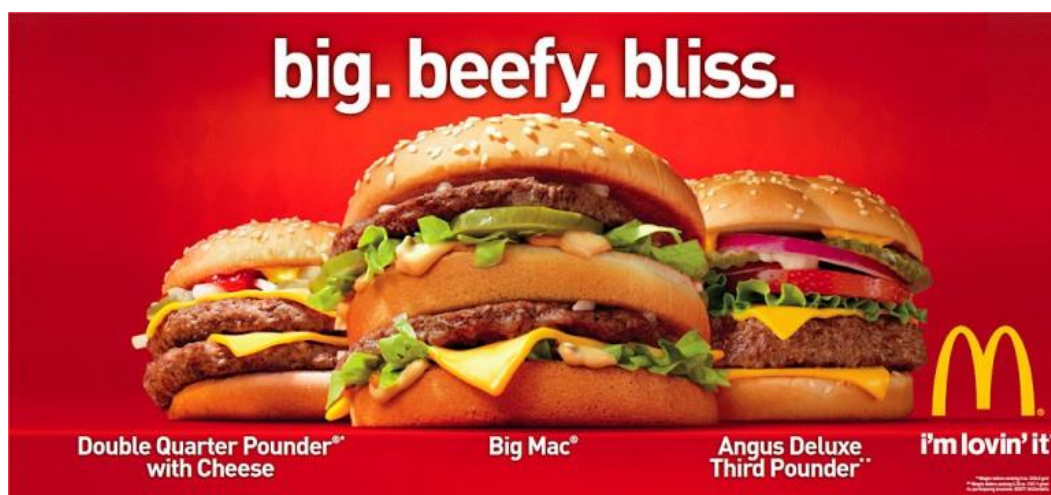
Sl.9. Primjer dizajnerskog principa ponavljanja oblika, sveukupno je oglas privlačan potrošaču zbog sheme boja i načina prikaza subjekata

Iako i društveni i kulturni običaji mogu definirati obrasce potrošnje hrane, u svijetu globalne proizvodnje hrane i ne-lokalnih izvora, branding može postati važniji za potrošače pri odabiru hrane. Činjenica da oglašavanje hrane može utjecati na odabir hrane nije nužno loša, ipak, problem nastaje kada su robne marke koje dobivaju najrasprostranjenije promocije u nezdravoj kategoriji. Postoje rezultati iz društveno-znanstvenih istraživanja koji pokazuju da prehrambeni proizvodi s najraširenijim publicitetom putem oglašavanja u glavnim medijima, sponzorstvom događaja i sličnim, imaju najlošiju nutritivnu vrijednost.[6]