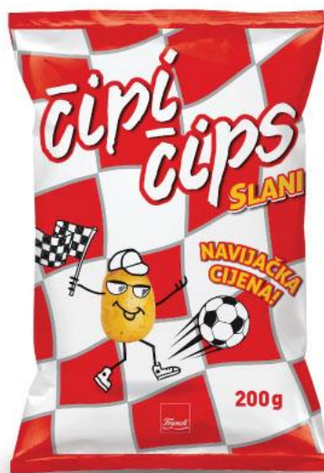
Sl.2. – primjer prilagodbe dizajna aktualnim trendovima u društvu, u svrhu poboljšanja prodaje, izvor Prehrana.hr

Dizajn ambalaže otkriva i odražava kulturne vrijednosti tržišta. Budući da se ambalaža prezentira na mjestima gdje se okupljaju ljudi različitog kulturnog podrijetla i vrijednosti, ona mora funkcionirati kao estetsko sredstvo komunikacije s raznolikom potrošačkom populacijom. Na mnogo načina, uspješni dizajner koristi aspekte antropologije, sociologije, psihologije, etnografije, i lingvistike tijekom postupka dizajniranja kako bi se razvila strateška rješenja dizajna. Uz pomoć opsežnih istraživanja tržišta i planiranja složene kombinacije elemenata, dizajn komunicira odgovarajuće kulturne vrijednosti za privlačenje ciljane skupine potrošača. Utjecaj kulturnih vrijednosti i vjerovanja na potrošačke odluke o kupnji ne bi trebao biti podcijenjen. Trendovi; moda i umjetnost; dob potrošača, financijska moć i etnička pripadnost - sve se odražava u dizajnu ambalaže (primjer Sl.2.). „Uspješan dizajn ambalaže stvara viziju u kojoj potrošači vide sebe i svoje želje, s kojom se poistovjećuju.“ [2]