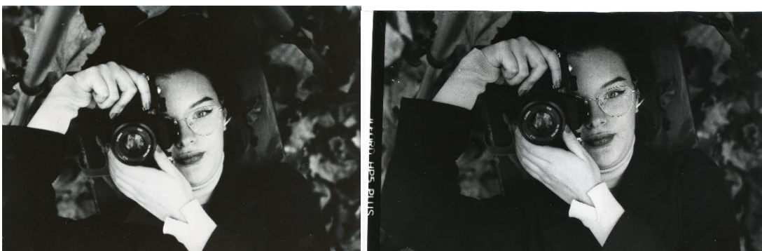
Slika 34: a) Ana_filter5_foma, b)Ana_filter5_IIFord

Na slikama 30, 31, 32, 33, 34, 35, 36 37, 38 i 39 prikazane su jedna kraj druge fotografije razvijene pod istim filterom na IIFord i Foma fotoosjetljivom papiru u svrhu njihove međusobne usporedbe. Razlika između te dvije vrste papira je najvidljivija u svjetlini dobivene fotografije, odnosno, vidljivo je da fotografija razvijena na IIFord-ovom papiru pod istima filterom, za svaki filter, je tamnija nego fotografija razvijena na Foma-inom papiru. Zbog toga dolazi do veće gustoće zacrnjenja i kontrasta na IIFord-ovim papirima.