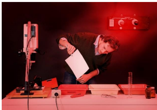
Slika 5: Proces i uređaji za razvijanje fotografije

Nakon što je fotoosjetljiv papir osvjetljen, potrebno ga je razviti kemijskim postupkom u razvijaju. Temperatura bi trebala biti oko 20°C i što je temperatura viša to će vrijeme razvijanja biti kraće i obrnuto. Razvijaj se nabavlja u koncentratu i potrebno ga je prije korištenja razrijediti s vodom prema uputama proizvođača. Razvijajka komponenta reagira s osvjetljenim srebrom halogenidima u emulziji i pretvara ih u crno metalno srebro. Prilikom razvijanja, papir u potpunosti treba biti uronjen u razvijaj i potrebno je konstantno miješanje razvijaja kako bi ravnomjerno dolazio do svih dijelova papira. Postupak razvijanja traje otprilike 3 minute, a nakon toga papir se prebacuje u prekidač. Prekidač je obična, destilirana, voda ili poseban prekidač razvijanja u kojem papir stoji 30-ak sekundi kako bi se s njega skinulo razvijaj i na taj način spriječilo njegovo prenošenje u fiksir. U fiksiru papir stoji nekoliko minuta pri čemu fotografija postaje stabilna na svjetlo i nakon fiksiranja fotografiju je moguće gledati po dnevnim svjetlom, a ne samo pod zaštitnim. Nakon fiksiranja papir je potrebno još jednom isprati običnom vodom nakon čega se stavlja na sušenje [3, 10] (slika 5).