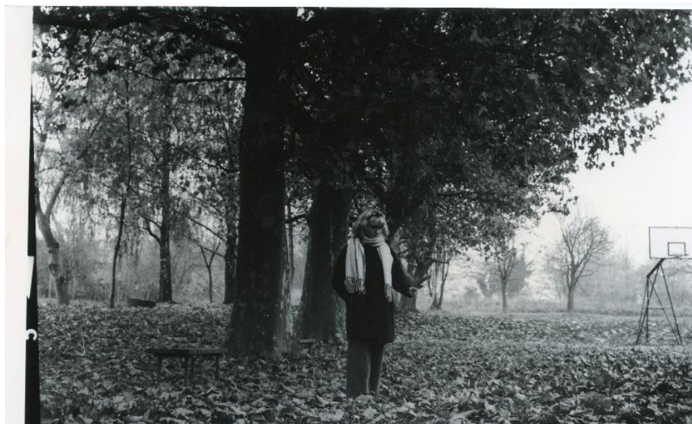
Slika 25 : Dorotea_filter3_IIFord

Slike 24 i 25 dobivene su razvijanjem pod filterom 3 na IIFord papiru. Fotografije dobivene s ovim filterom imaju veliki kontrast i gustoću zacrnljenja pa na nekim mjestima može doći do gubitka detalja. Na fotografiji 24 sa ovim filterom je postignut odličan kontrast kojim je oko došlo do lijepog izražaja, lišće u pozadini se lijepo vidi, a ten izgleda prirodno. Na slici 25 ovim filterom je također postignut dobar kontrast, što je vidljivo na lišću, međutim mjesta koja su u sjeni ovim se filterom na njima skroz izgubili detalji.