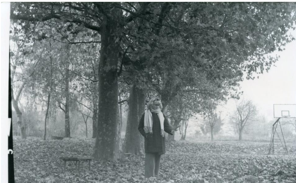
Slika 21 : Dorotea_filter1_IIFord

Kao rezultat korištenja filtera 1 dobiju se svijetle fotografije kod kojih su kontrast i gustoća zacrnenja slabi. Slika 20 ima ispran efekt, ali sve nijanse su se lijepo uklopile i fotografija izgleda lijepo, ima šum koji joj daje posebni efekt, a isto to postignuto je i na