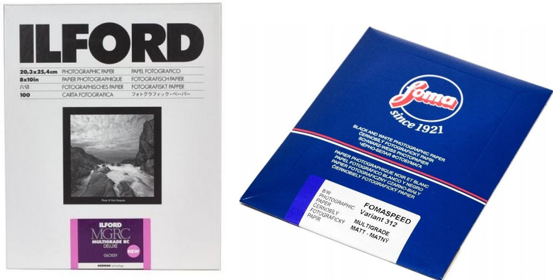
Slika 8: a) ILford , b) Foma multigrade papiri

Film koji je korišten za snimanje fotografija je Fomapan b/w negativ film ISO 100/21. fotoosjetljivi papiri koji su korišteni za potrebe ovog rada su: ILfordMGRC multigrade RC deluxe perle (slika 8a) i FomaSpeed Variant 312 multigrade matt (slika 8b).