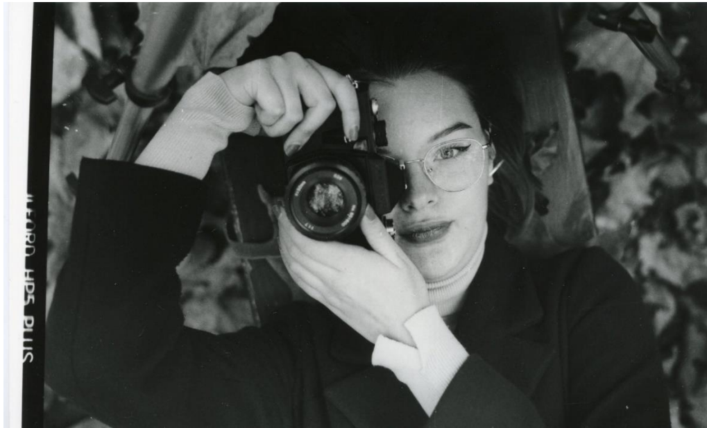
Slika 33 : Ana_split-filtering_IIFord

Na slikama 32 i 33 su prikazane fotografije dobivene tehnikom split-filtering-a. Fotografije su prvo razvijene pod filterom 2 kako bi se postigli lijepi tonovi i malo smanjila gustoća zacrnjenja na tamnijim dijelovima slike, a potom pod filterom 4 kako bi s pravom količinom kontrasta detalji došli do izražaja. Slika 32 je razvijena na Foma fotoosjetljivom papiru, a slika 33 na IIFordu. Međusobnom usporedbom fotografije vidljivo je da su u oba slučaja „zahtjevi“ split-filtering-a zadovoljeni, odnosno, na obje fotografije ostvarena je dobra svjetlina, ten izgleda prirodno, oko se dobro vidi, čisto je, i lišće je dobro prikazano. Ipak, bolji efekt je ostvaren na slici 33 na IIFord-ovom papiru jer je ostvaren malo bolji kontrast, a i detalji su došli do boljeg izražaja (rukav, oko) te zbog šuma koji se ostvaruje na IIFord-ovim papirima, fotografije u kompletu izgledaju ljepše i prirodnije.