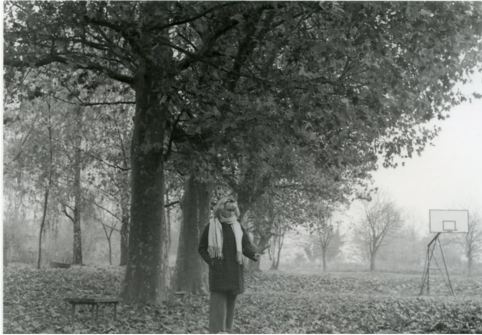
Slika 11: Dorotea_filter1_foma

Slika 10 predstavlja fotografiju motiva portreta koja je razvijena na Foma multigrade papiru koji je osvjtljen kroz filter 1. Filter 1 je najmekši filter kojim se dobivaju slabi kontrasti na fotografiji i zbog toga se fotografija doima blijedo, ima „isprani“ efekt, te se radi slaboga kontrasta detalji gube i manje dolaze do izražaja. Ovaj filter se koristiti za postizanje maglovitog i blijedog efekta jer se njime dobivaju najsvjetlije fotografije, ali za prikazivanje detalja nije najbolja opcija.