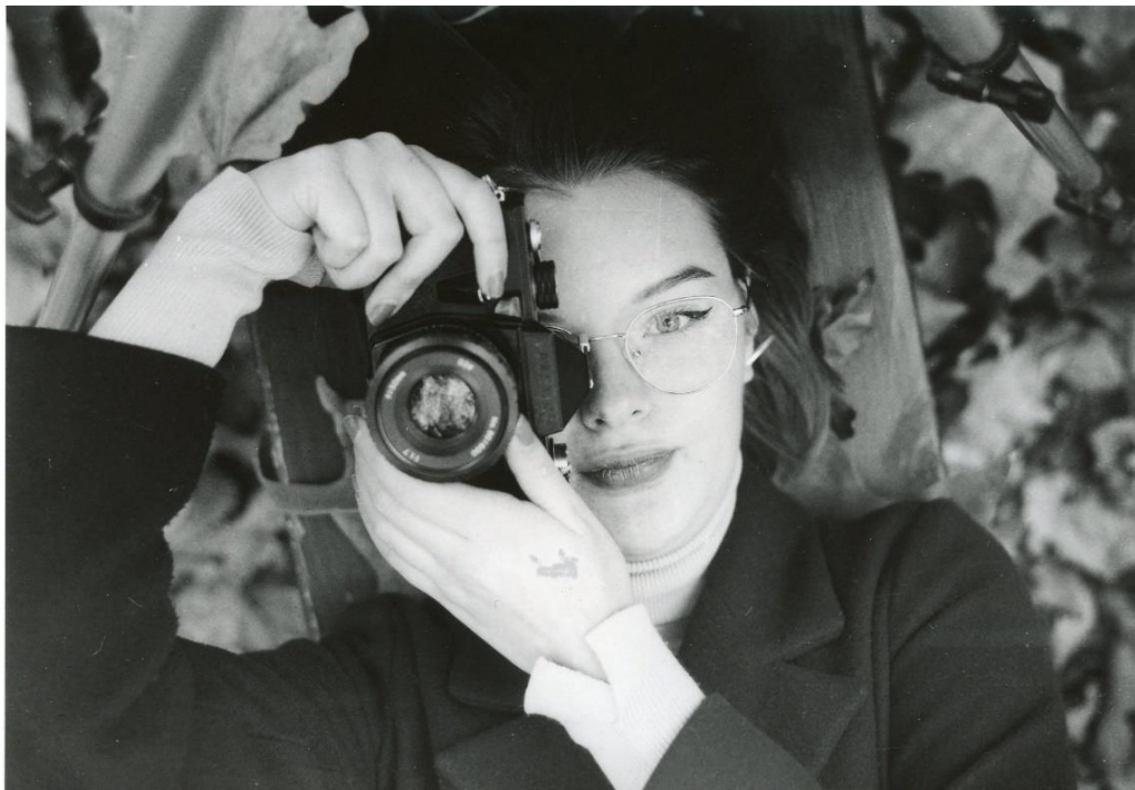
Slika 14: Ana_filter3_foma