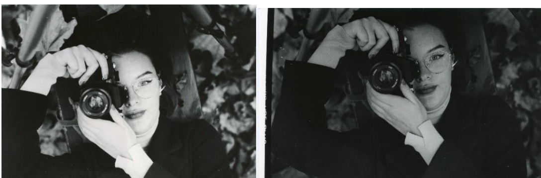
Slika 33: a) Ana_filter4_foma, b)Ana_filter4_IIFord