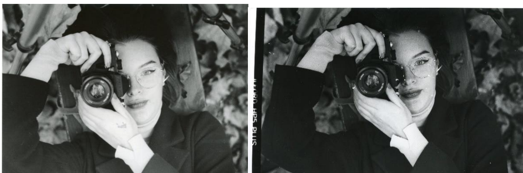
Slika 32: a) Ana_filter3_foma, b)Ana_filter3_IIFord