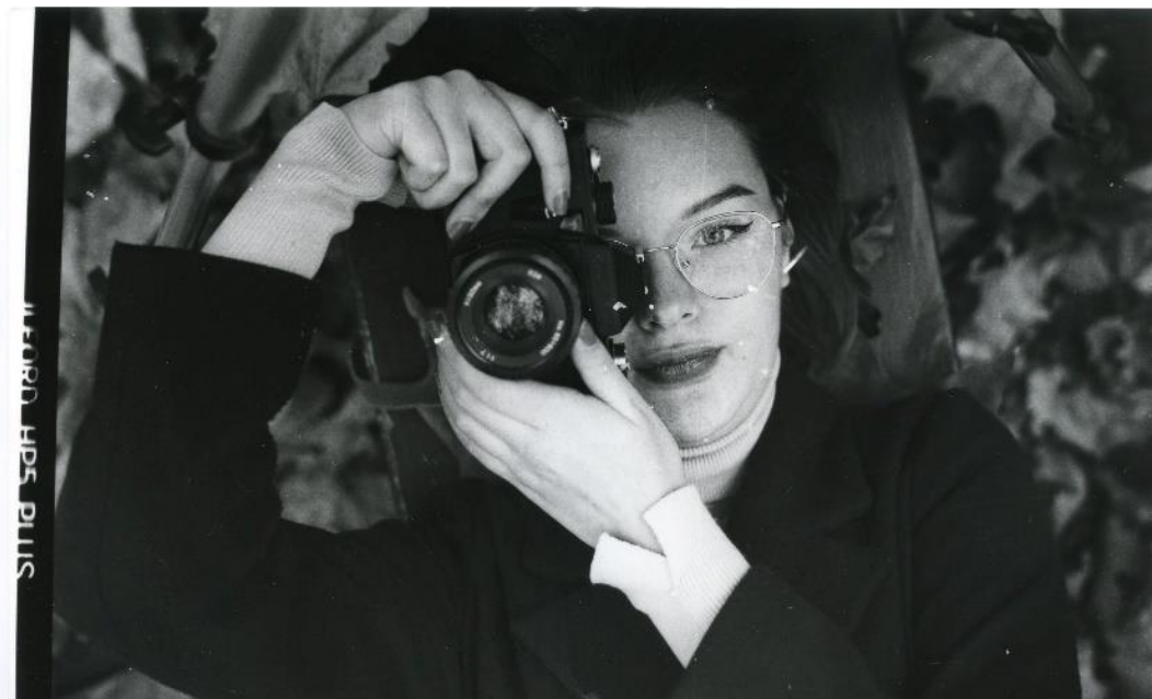
Slika 24 : Ana_filter3_IIFord