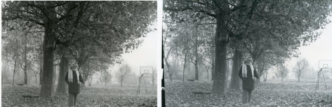
Slika 35: a) Dorotea_filter1_foma, b)Dorotea_filter1_IlFord

Unatoč tomu, fotografije na IlFord -ovim papirima izgledaju čišće iako imaju veću zrnatost fotografije. Također, postoji i veći raspon sive. Na njima su detalji za isti filter jasnije prikazani i sveukupno fotografija na ovim papirima izgleda ljepše, izgleda više vintage i to joj daje posebnost.