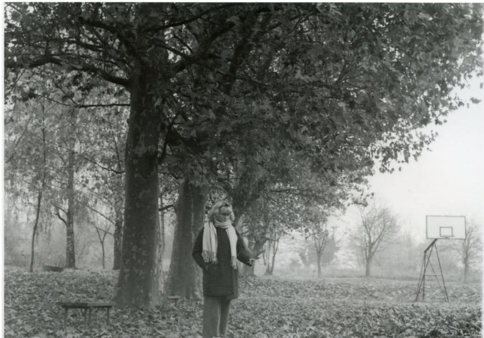
Slika 13 : Dorotea_filter2_foma

Na slikama 12 i 13 prikazane su fotografije razvijene kroz filter 2. Ovaj filter u odnosu na filter 1 je daje malo bolje rezultate jer je malo tvrđi, daje veći kontrast fotografiji,