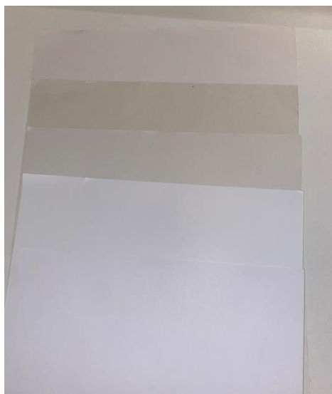
Slika 6: Uzorci papira