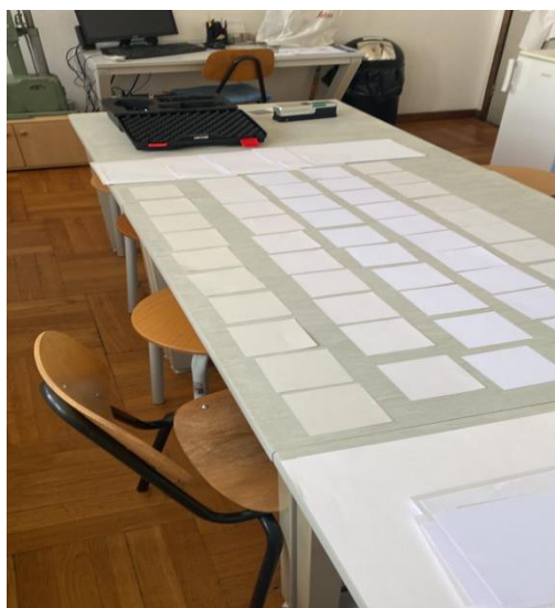
Slika 11: Uzorci papira veličine 10x10 cm

Debljina papira određivana je mjerenjem na mikrometru (slika 9). Mjerenje je obavljeno tako da se uzima uzorak veličine 10x10 cm, koji je prethodno izrezan na giljotini (slika 7), postavi između dvije paralelne metalne mjerne plohe, te se njihovim pritiskom odredi debljina. Za svaki papir obavljeno je po 20 mjerenja iz kojih je izračunata srednja vrijednost.