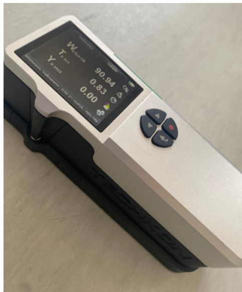
Slika 10: SpectroDens