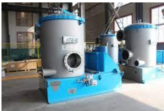
Slika 4: Uređaj za pročišćavanje

U ovom trenutku prosijava se kašasta masa. Pulpa se gura u sita s prostorom i rupama različitih oblika i veličina. Kraj ovog procesa je da se ukloni onečišćenje iz pulpe, te filtriraju neželjene objekti [3].