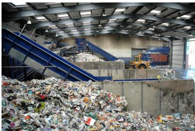
Slika 2: Sortiranje papira

( https://www.no-waste-technology.com/en/sorting/paper-sorting ), pristup: 13.8.2022.