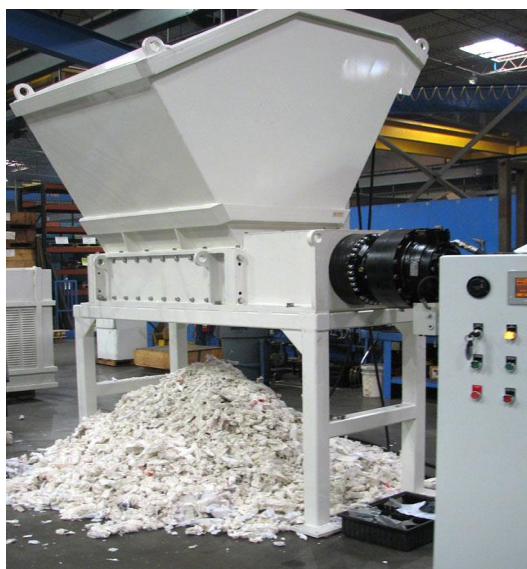
Slika 3: Uređaj za usitnjavanje papira

Nakon što je sortiranje završeno, sljedeći korak uključuje usitnjavanje nakon čega slijedi pulpiranje. Usitnjavanje se vrši kako bi se papirni materijal razbio na male komadiće. Nakon što je materijal fino usitnjen na komadiće, miješa se s vodom i kemikalijama za razgradnju materijala od papirnih vlakana. Razvlaknjivanje je proces koji pretvara papirnate materijale u kašu. Ovo je točka gdje se podvrgava procesu zagrijavanja koji ga pretvara u pulpu, što se postiže dodavanjem vode i kemikalija kao što su kaustična soda i vodikov peroksid [3].