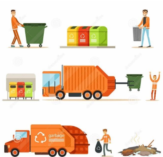
Slika 1: Prikupljanje i transport otpada