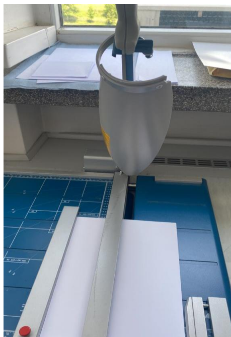
Slika 7: Giljotina

Giljotina je uređaj za rezanje papira čija je gornja i donja oštrica od brušenog kvalitetnog čelika. Ima prednji stol s graničnikom i laserski modul. Vrhunska sigurnost je zajamčena rotacijskim štitnikom. Posjeduje vodilice s oznakama u centimetrima i inchima.