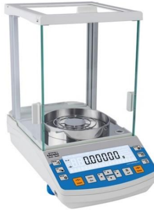
Slika 8: Analitička vaga

Analitička vaga je uređaj koji garantira pouzdanost i točnost mjerenja s preciznošću od 0,0001 g. Sadrži komoru za vaganje gdje se odlažu predmeti koji će se vagati. Ima i LCD ekran koji omogućava jasan prikaz rezultata mjerenja.