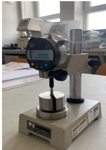
Slika 9: Mikrometar

Elektronički ručni mikrometar namijenjen je ispitivanju debljine papira, kartona i sličnih materijala. Mjeri u rasponu od 0-10 mm s točnošću od 0.001 mm. Sastoji se od dvije metalne plohe između kojih se stavlja ispitivani materijal, te se njihovim pritiskom izmjeri debljina.