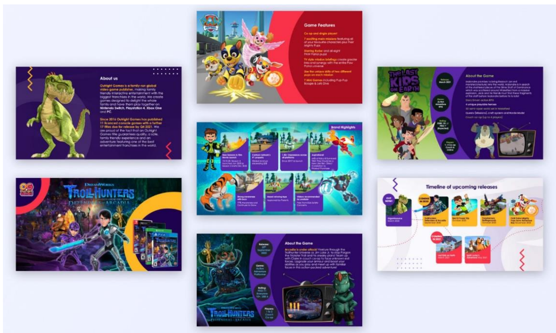
14. Brošura za nadrealistični dizajn raznih web igrica