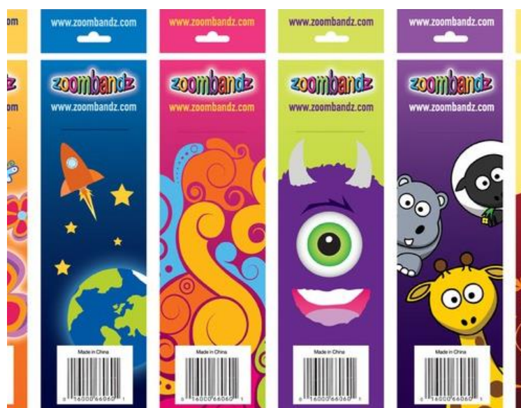
13. Primjer nadrealizma u dizajnu ambalaže brenda Zoombandz