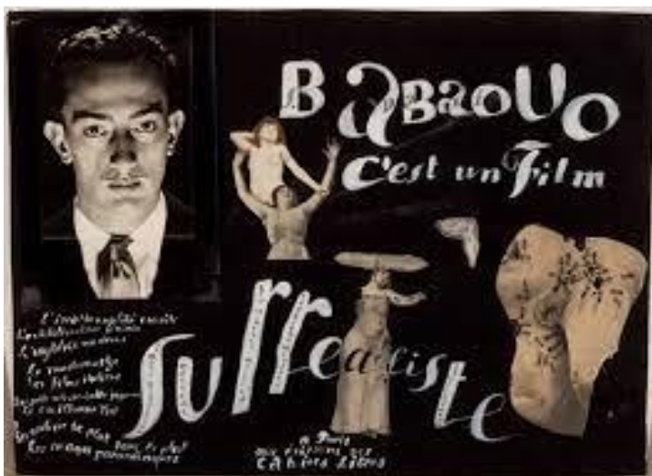
8. Plakat za film Babaouo - C'est un film surréaliste , Salvador Dalí, 1932.

1932. godine dizajnirao je plakat za film Babaouo - c'est un film surréaliste . U ovom plakatu koristi se tamnim tonom. Na plakatu se nalazi njegov portret, dvije djevojke u pokretu, čudan ljudski lik, nalik na ženi koja nosi neodređen predmet na glavi, sata koji se topi identičan onom iz slike Postojanost pamćenja , te u donjem lijevom kutu nepoznat predmet na kojem se nalazi puno mravi. Vidljivo je da je i ovdje ponavljao svoje omiljene motive. Na ovom plakatu upotrebljava različitu tipografiju, čak se razlikuje i od slova do slova u nekim dijelovima.