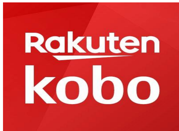
Slika 6. Logo Kobo

Što se tiče konkurencije u njihovom poslovanju, ona je jako velika. Apsolutni vladari ove vrste poslovanja su Amazon, Barnes and Noble i Apple. Sve te firme imaju visoku kvalitetu svojih proizvoda te oni uzimaju veliku većinu kupaca u svijetu. Međutim, Kobo se smatra kao poduzeće koje je najbliže toj velikoj trojci. Najveći problem ovoga poduzeća je taj što nudi jeftini hardver koji jednostavno nije privlačan korisnicima.