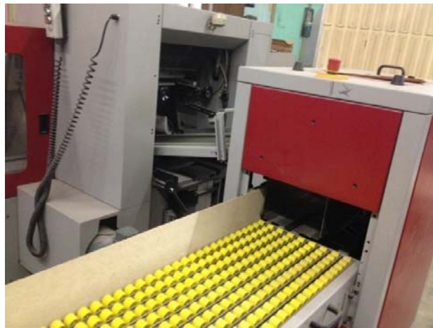
Slika 7. Izlagaća stanica

Izlagaća stanica (slika 7.) je zadnji dio stroja za šivanje koncem. Dolaze sašiveni knjižni blokovi, skidaju se sa stanice, slažu na paletu i sašiveni knjižni blokovi spremni su za daljnju doradu. Isto kao i na ulagaćem aparatu potrebno je podesiti širinu i dužinu arka i debljinu hrpta.